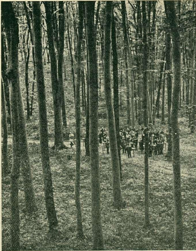
A tanulmányút résztvevői a szarvaskúti bükkösben

a többi európai országban az erdő és termőhelytérképezést az erdőrendezősek, vagy azok szervezetei végzik, s a gyakorlati szakemberek közel sem olyan járatosak ez ismeretkörben, mint hazánkban,