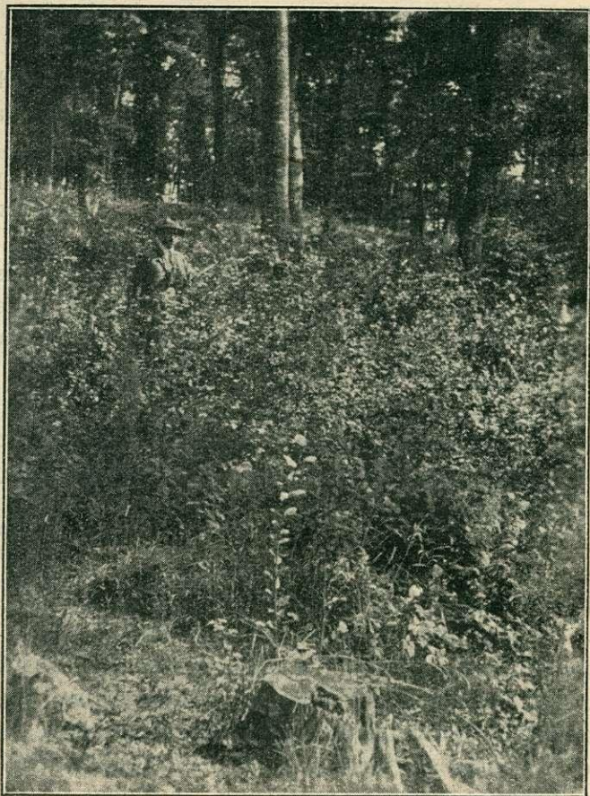
6. kép. Mailáth gr. hitb. erdőgazdasága Bakóca. Természetes bükk- és tölgyújulat egy csoportja a korpádi erdőben az 1928-i makktermésből.

előfeltételeiként: kellő elméleti és gyakorlati felkészültség, acélos szervezőképesség, helyes gazdasági érzék és mindennél erősebb szakszeretet, amely a vállalt munkakört nemcsak a mindennapi kenyér egyszerű ellenszolgáltatásának tekinti, hanem azt hivatásnak érzi és áldozatos szívvel szolgálja.