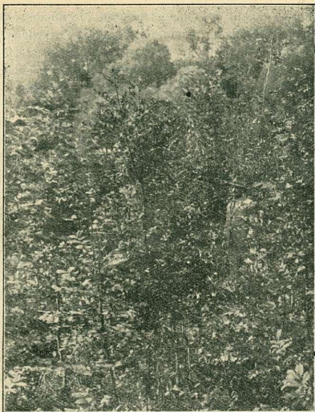
3. kép. Kir. közalapítvány szekszárdi erdőgondnoksága, 1929. évi magas körisültetés az ösényi árterületen.