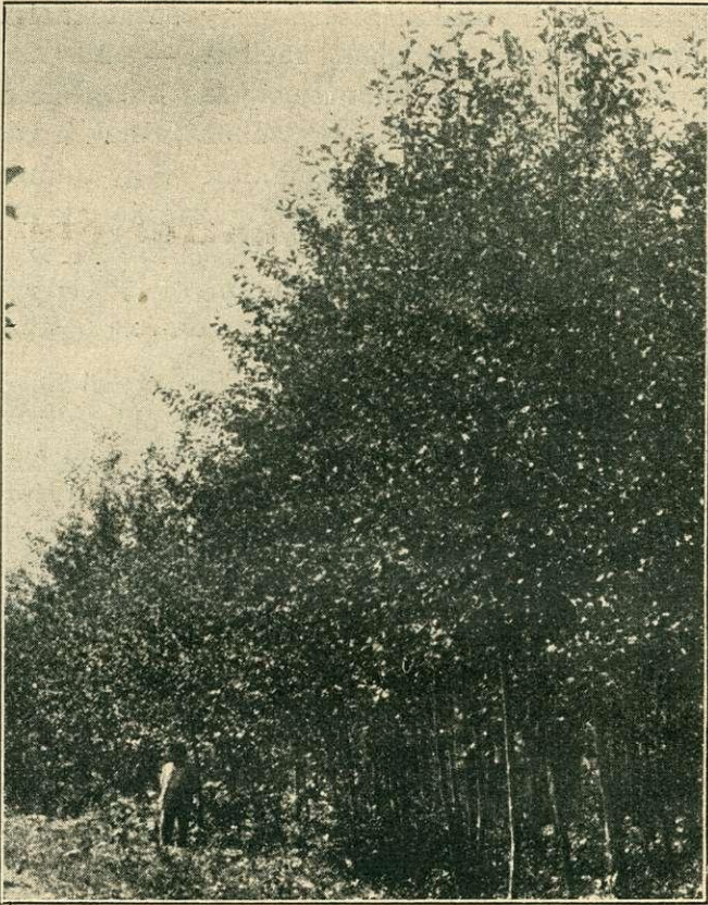
1. kép. Kir. közalapítvány szekszárdi erdőgondnoksága. Az öcsényi régi Dunamederben telepített mézgás égerállomány. 1928. évi ültetés.

elég, ha maradandó benyomásként átfogó képet kap azokról a végletekről, amelyek egy szűkreszabott ország határain belül is a magyar erdőgazda feladatkörét jelzik.