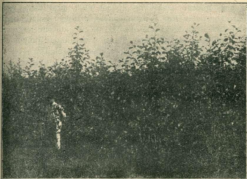
2. kép. Kir. közalapítvány szekszárdi erdőgondnoksága. Mézgás égerültetés 1931-ből az öcsényi árterületen.