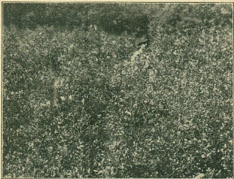
4. kép. Kir. közalapítvány székszárdi erdőgondnoksága. Magas kőrös természetes úton való felújítása az öcsényi árterületen (5—6 éves).

De ma már talán ez sem utópia többé. S ha egyszer megindul a normális erdőgazdasági üzem a buckák között, ha a boróka helyét záródott állományok foglalják el és az első át-erdőlések ontják majd a szállításra váró anyagot, akkor mégis milyen nagyszerű intézmény lesz a vasút és milyen áldott azoknak az emléke, akik megépítették.