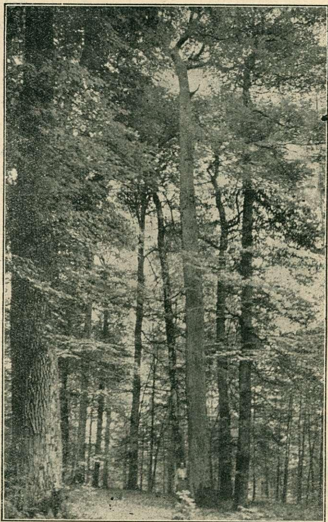
Igy néznek ki a Spessart-tölgyek 22—27 méterig ágatiszta törzs bükkkel körülvéve, fönt aránylag kis korona. Nagyrészt műfa.

sanként mintegy 20 fűrésztelep létesül a Spessart körül, melyek helyben bútorfának dolgozzák fel. Ezek konkurenciája is igen hozzájárult az értéknövekedéshez. A legnagyobb értéknövekedés azonban akkor állt be, midőn 1890 után furnírnak kezdik feldolgozni. 1910-ben 1 m 3 furnírfa 318 M, 1927-ben 665 M, így