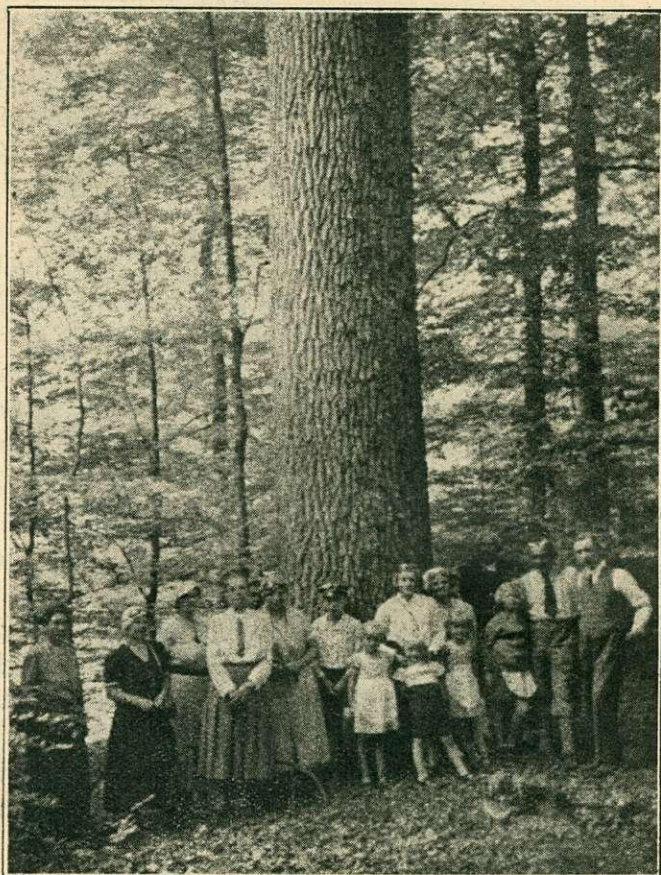
Egy tölgy a bajor Spessartból, körülötte bükk alátelepítés.

kis üvegeket gyárt, de már nem az erdőt veszi igénybe, nem fahamut, hanem sodasulfatot használ.