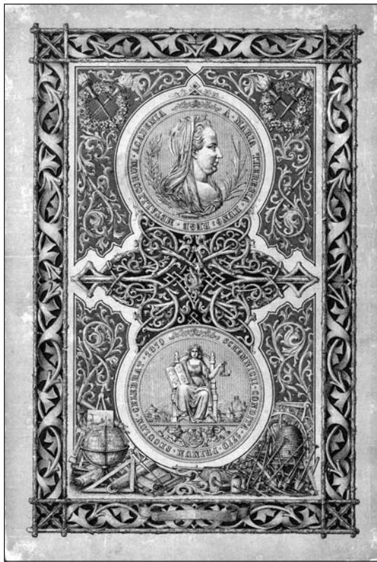
Az emlékkönyv hátsó borítója

Végre 1763-ban dicső Mária Thereszia királyunk uralkodása alatt kezdett oszolni azon homály, mely a bányászati tudományokat körülvette s fogamzott meg a terv egy önálló bányászati főtanintézetnek Selmecezen történő alapítására, melyen már a következő év 1-ső szeptemberével kezdetét is vette a nyilvános tani-