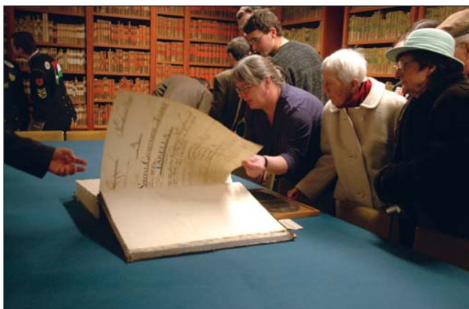
Erdészeti rendtartás a Reformkorból