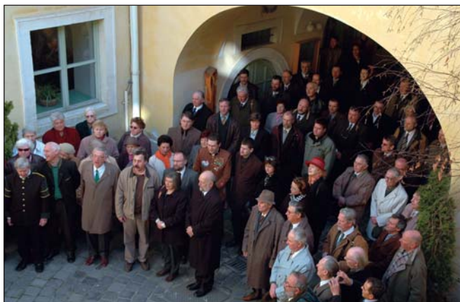
Erdészek, bányászok, soproni polgárok