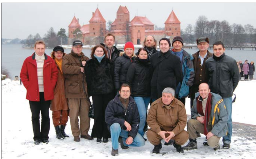
A résztvevők egy csoportja a trakai-i vár előtt

A FAO UN (Food and Agriculture Organisation of the United Nations), az IUCN (The World Conservation Union) és a CEPF (Confederation of European Forest Owners) keret-megállapodása alapján 2001 óta e szervezetek közösen rendezik azokat az erdészeti politikai rendezvényeket, amelyek Kelet-Közép-Európában (KKE) az erdőgazdálkodás általános fejlődését, illetve számos esetben speciálisan a magánerdő-gazdálkodás fejlődését voltak hivatva segíteni. A sorozat hét rendezvényre tekint eddig vissza: Róma/2000, Bled/Slovenia/2001, Zidlochovice/Csehország/2002, Riga/2003, Zamárdi/Magyarország/2004, Durdevac/Horvátország/2005, Kernava/Litvánia/2007.