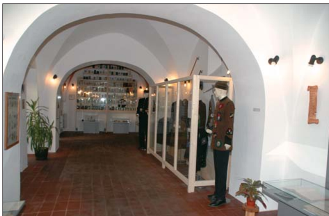
Valdenek, korszok, relikviák