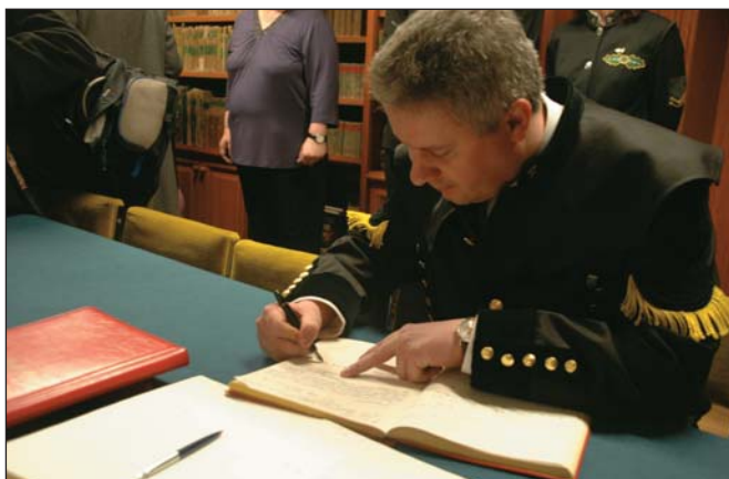
A selmechányai polgármester beír az emlékkönyvbe