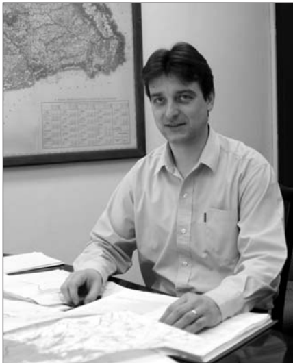
Csomós János, a hatóság képviselője

Az üggyel kapcsolatban az erdészeti társaság és az erdészeti hatóság illetékesei azt az álláspontot foglalták el, hogy amíg nem ismerik a feljelentés szövegét, és nem tudják, hogy mivel vádolják őket, addig nem lépnek a nyilvánosság elé. Ez méltányolható, de a mai mediatisztált világban nem célszerű álláspont.