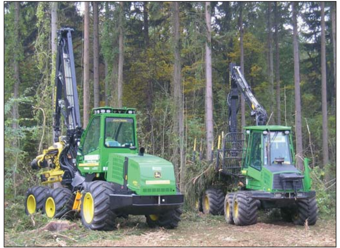
Processzor és kihordó

egyre magasabb fokon automatizáltak, számítógép által vezéreltek;