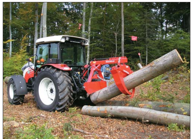
Markoló adatper munkában