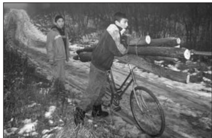
A fiatalság munkában

Jelenleg az üzemtervek nem tartalmaznak számszerű magyarázatot arra,