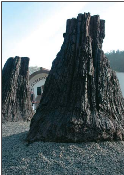
Az ipolytarnóci törzsek

Négy mocsári ciprust már a miskolci Herman Ottó Múzeumba szállítottak. A fákat a szállításig folyamatosan vízzel itatták át, megakadályozva állapotuk további romlását. A legnagyobb négy méter