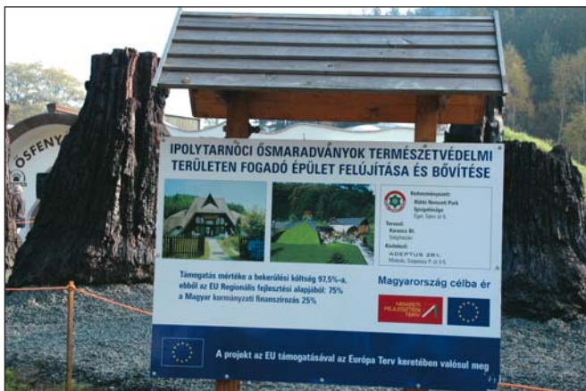
Eligazító tábla a vadonatúj létesítménynél