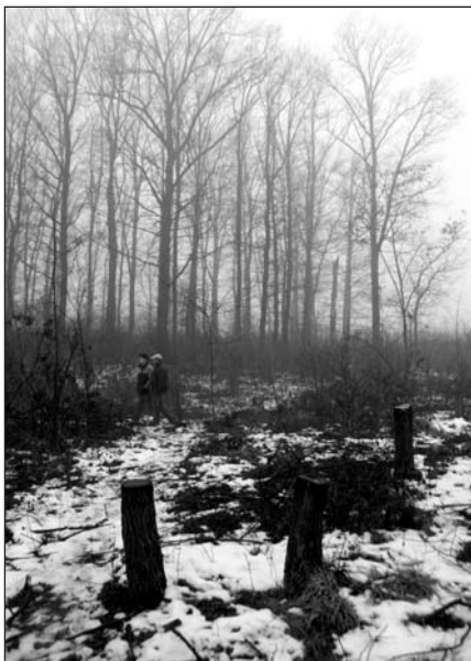
Tájékép csata után

A társaság nem saját erővel oldotta meg ezt a feladatot, hanem őrző-védő cégeket bízott meg. Ezeket elsősorban a leginkább fertőzött területekre irányította. Az erre fordított költség elérte az évi tízmilliós nagyságrendet. Ráadásul az eredményesség és hatékonyság erősen vitatott. Százhektáros területeket megvédeni csak nagyon nagy létszámú előerővel – fegyveres, kutyás őrökkel – lehet, amit már nem képes finanszírozni egyetlen társaság sem.