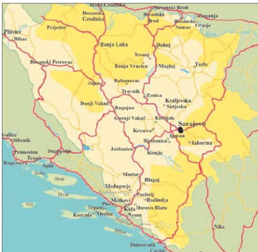
Narancssárga a Szerb Köztársaság, rózsaszín a Bosnyák-Horvát Föderáció területe

A Szerb Köztársaságban – a szlovák és horvát rendszerhez hasonlóan – egy egységes államerdészeti szervezet működik. A Bosnyák-Horvát Föderációban sokkal bonyolultabb az erdőkezelés rendszere. Amellett, hogy az országnak van közös parlamentje, külön-külön parlament is van a két államalakulatban. –Sőt a Bosnyák-Horvát Föderáció kantonjainak külön minisztériumaik vannak. A nagyobb erdőterülettel rendelkezőknél az erdőgazdálkodás a mezőgazdasági, erdészeti és vízügyi minisztériumokhoz, kisebb gazdasági jelentőségű erdőterülettel rendelkezőknél a környe-