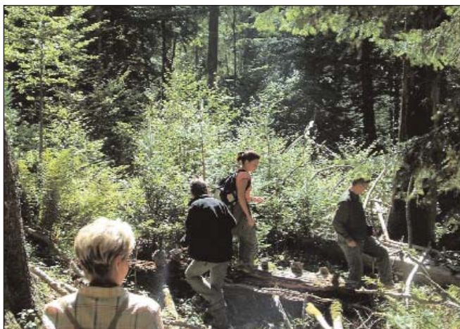
Erdészek az őserdőben

A park a hegyek között, 432 méter magasan, az Adriai tengertől harminc kilométerre található. 7441 hektáros, sík terület, a tavak körüli végtelen nádasokkal. Hat különböző nagyságú tó van összekötve csatornákkal. A legnagyobb 1163 hektáros. A mediterrán klíma a Neretva völgyén húzódik fel, aminek köszönhetően narancstermesztés is folyik.