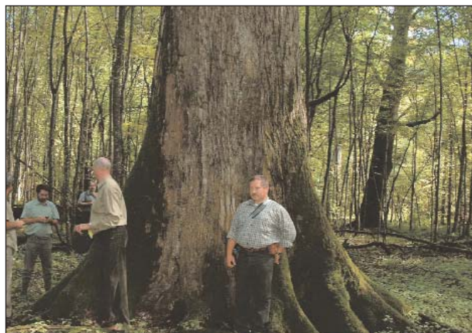
Szlavón tölgy méretei

Mostari városnézés után horvát vendéglátóink bemutatták a nemzeti parkot.