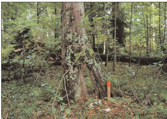
Az őserdőre jellemző lábasfa