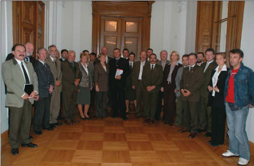
Kárpát-medencei erdészek Szili Katalin elnöksasszony társaságában

Az Országos Erdészeti Egyesület 2007 évi programjának megfelelően megszervezte a Kárpát-medencei Erdészek I. Találkozóját Budapesten. Kárpátaljáról (Ukrajnából) nem sikerült az erdészek csatlakozása, rajtuk kívül minden környező ország erdészei képviselték magukat, összesen 18-an.