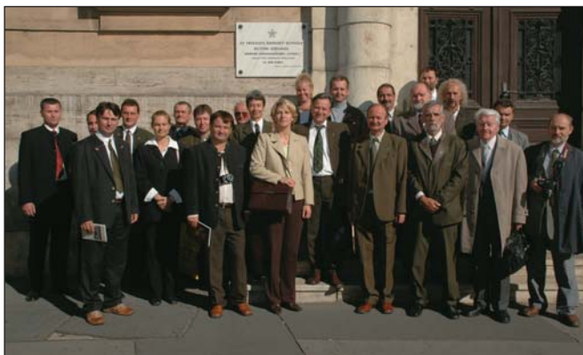
A résztvevők ősi székházunk emléktáblája alatt

– Elsőrendű feladat az erdőgazdálkodásban a fenntarthatóság megvalósítása és az erdőgazdálkodás szerepének növelése a társadalmi-gazdasági életben, az erdők visszaszolgáltatásának