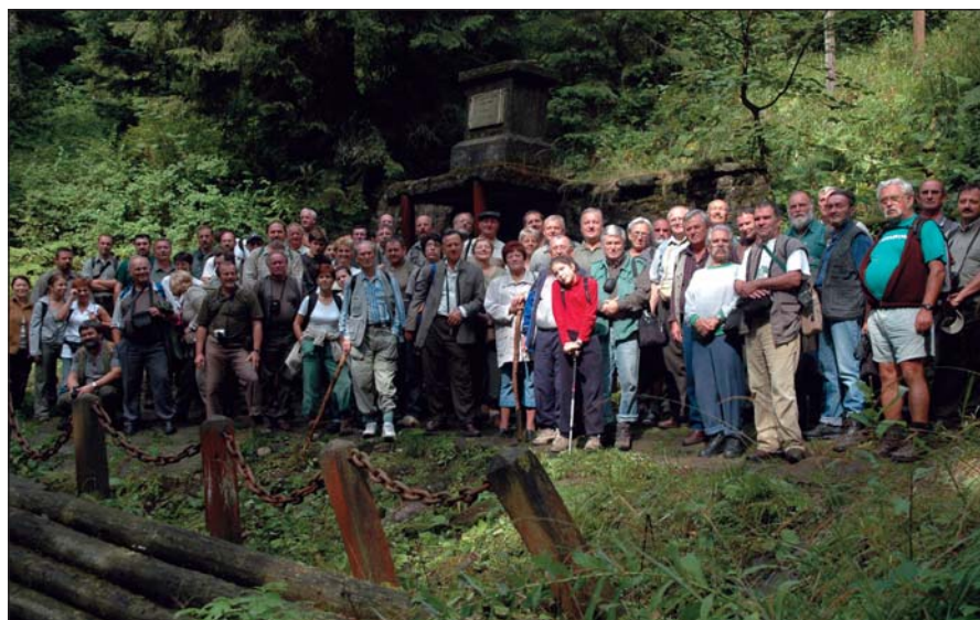
A résztvevők a Tisza-forrásnál