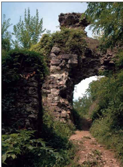
Husztnak rom vára... megállék

„Száz meg száz szív dobogott fel erősebben a magyar erdészek kebelében, midőn elbanguzott a felszólítás a közgyűlésen való részvételre.” Augusztus 19-én, meglehetősen rossz időjárási körülmények között kezdődött a közel egyhetes rendezvény. „Legkomorabb volt vezérünk, Bedő alelnök, ki gyengélkedése miatt az eljövételre is némi önfeláldozással batározta el magát.” Királybáznál Tisza Lajos elnök csatlakozott a résztvevőkhöz, kit a „baragosan zúgó Tisza elég barátságatlanul fogadott.” Máramarosszigeten a választmányt a fellobogozott megyebáza fogadta. 150 tag jelenlétében megkezdődött az első ülés. A tükári jelentésből kiderült, hogy az egylet vagyona meghaladja a 150 ezer arany forintot. „Szerencsére az ég gondoskodott a múlt napokban arról, hogy a kocsik bosszú sora a port fel ne verje, s így a sereg derült ég és derült kedély mellett vígan robogott a megszikkadott úton Bocskó felé, hol mozsarak durrogása közt egy csinos diadal út Viruljon hazánk erdészete felirattal számtalan nemzeti zászló és a helység népének megújuló éljenzése fogadták a társaságot. Még távol voltunk Rabótól, midőn egy kanyarulatnál 24 tagból álló bandérium állott az élünkre. Ünnepi ruhába öltözött egyszerű orosz (minden bizonnyal ruszin. A szerk.) parasztok voltak. Rabón az ablakokba helyezett számtalan gyertyafény mellett egy egész sor oszlopra erősített szurokfáklya világított...”