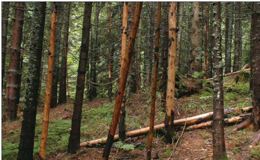
Szűkárosított fenyves a Fekete-Tisza forrásvidékénél