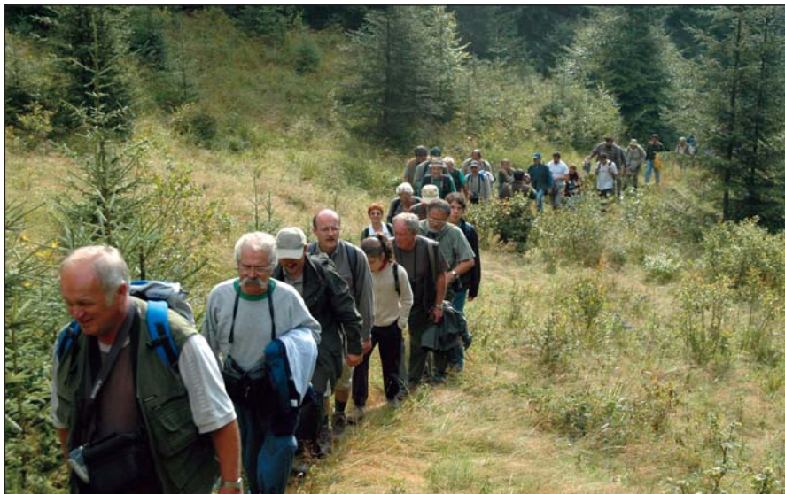
A kanyargós ösvény mentén a Tisza-forráshoz