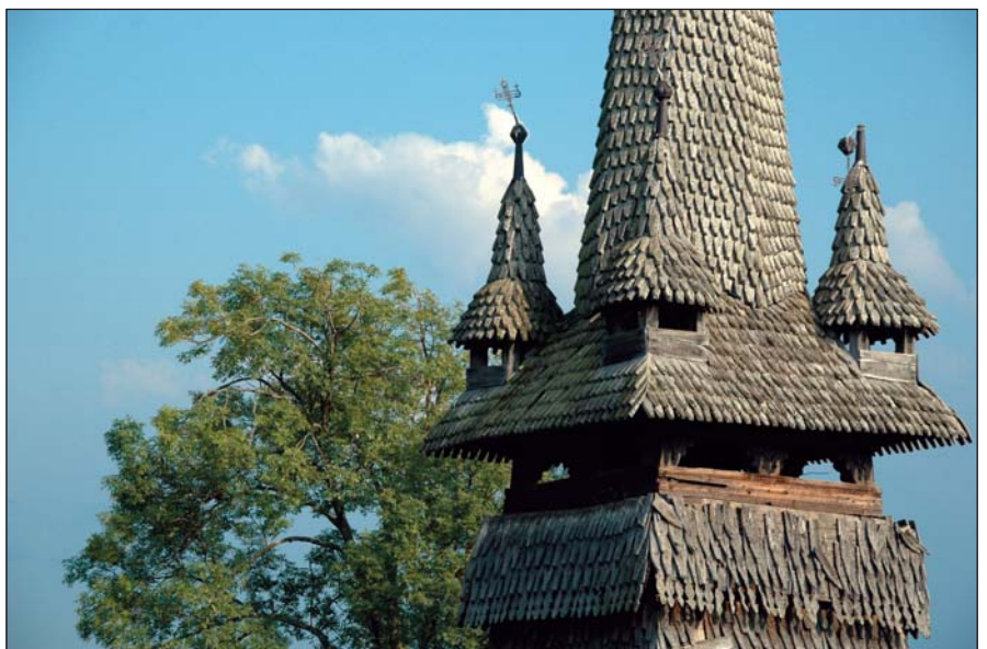
A faművesség csúcsa a szeklencei templom