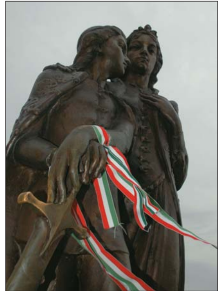
II. Rákóczi Ferenc Zrínyi Ilonával

De ha már a hitéletéről beszéltünk, meg kell említenem az emléktúra egyéb kultúrtörténeti látványait is. A beregszászi rö-