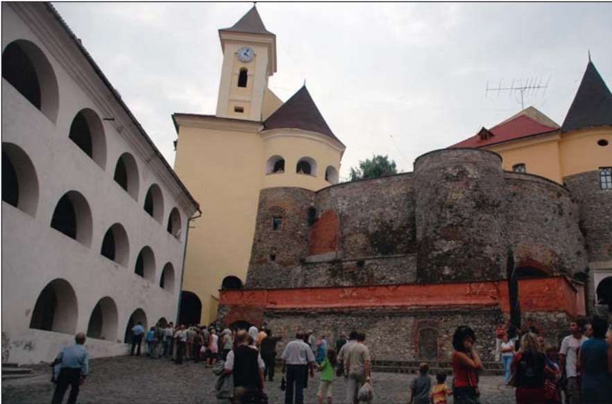
Munkács vára már látogatható

Emléktúra a Fekete-Tisza forrásához az OEE 1882. évi vándorgyűlésének 125. évfordulóján