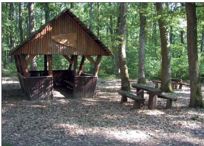
A csepregi pihenőpark esőbeállója; cikket lásd a 86. oldalon