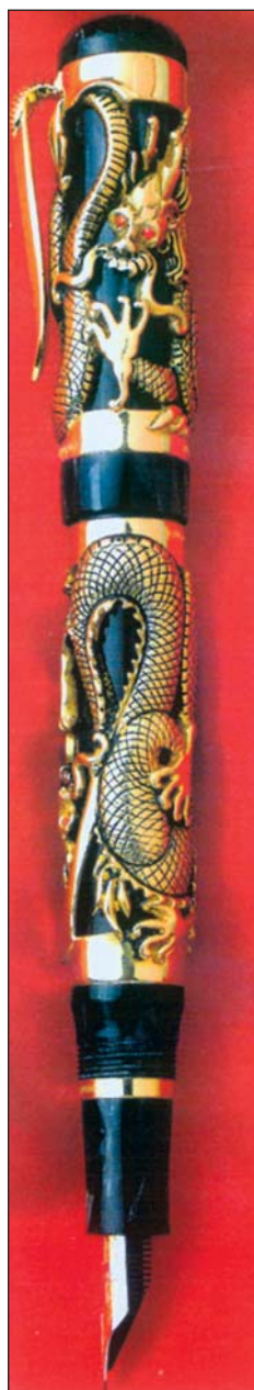
„ Dragon ” = sárkány, ezüst magasdomborművű cizellált felület, rubin beépítéssel, Frederico Monti alkotása

A tollszárak egyenesen elbűvölők, csiszolt, lakkozott faanyagok, ébenfa mellett gyöngyház, üveg, bakelit, arany,