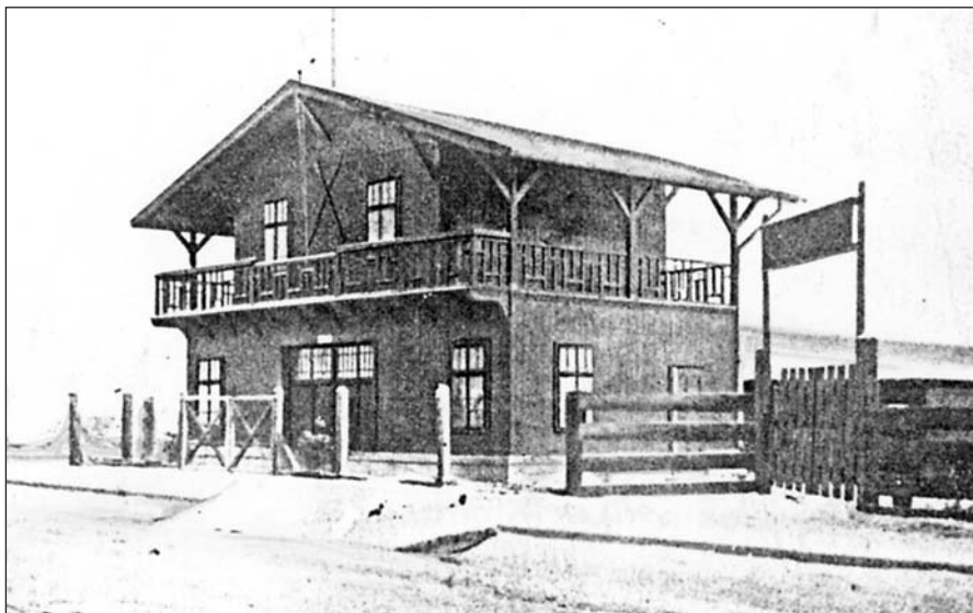
MEC clubház a Duna mellett, kikötőstéggel

Az emeletes teraszos faház a Bertalan utcában (modell, megrendelésre számítva). Helyére az egyetem legmagasabb háza a tízeleemes „Z” épület épült 1983-ban. 1910-ben Divald Károly levelezőlapot készített a klubházzal.