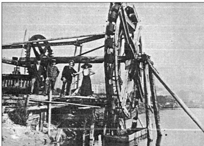
Lágymányosi „bolgárkerék”, 1910.