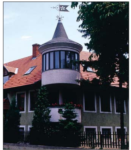
Az erdészet épülete Kapuváron

Négy országos-vására jan. 10., mart. 25., jul. 25., nov. 1. s minden csötörtökön hetivásár. Folyóvize a kis Rába, melly régen a várt két ágával bekerítette. E vár hajdan a nevezetesb erősségek közé tartozott; a török ellen 1559. 30 t.czikk szerint megerősítettet rendeltetett. 1656. a bádeni fejedelem ostrommal bevén, a törököktől roppant hadikészületek foglaltattak el. 1708. Rákóczy seregei bevén, leromboltatt, s régi erősségének nyoma sincs. Említést érdemel, hogy 1749 mart. elején a halászok a Hanságban levő királytóból egy 8 éves vadgyermeket hálóval fogtak ki, ki is az uradalmi lakba vitetvén, mart. 17-kén Hany Istvánnak kereszteltetett, s már beszélni és némi munkát tenni is kezdett, midőn vigyázatlanságból megszökött, a Rába folyóba ugorván. Birja Kapuvárt h. Eszterházy Pál.