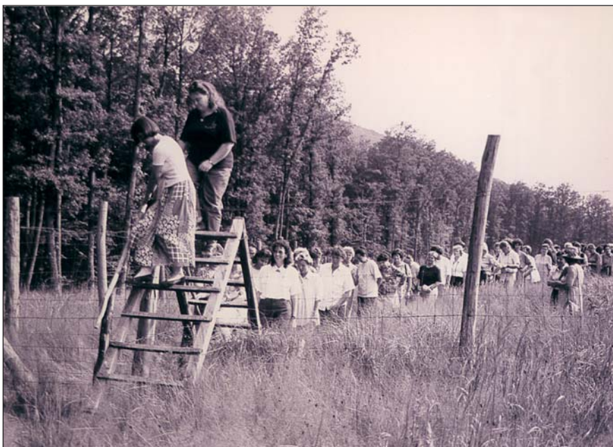
1994-ben a felújítást megtekintették a II. Erdésznök Találkozójának résztvevői

Bemutatóhely: Nagyhalmaj-rét és annak 200 m-es körzete