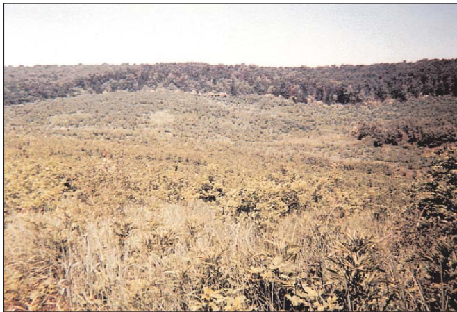
3. ábra: A Sajókápolna 1 D (háttérben) és 7 D (előtérben) erdőrészek 4 évvel az 1997-es erdőtűz után

1998-tól felhagytunk a tűzveszélyes peremterületeken addig szokásos tarvágás utáni mesterséges erdősítésekkel, amikor is a zömmel sarj eredetű cseresek után kocsánytalan tölgy makkvetéssel végeztük a szerkezetátalakítást. Elsődleges célunk az újabb erdőtűzek elkerülése mellett a korábban keletkezett károk helyreállítása, az erdősítések minél előbb