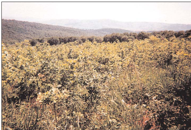
4. ábra: KTT-KST állomány 4 évvel az 1997-es erdőtűz után (Sajókápolna 7 D)