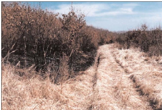
6. ábra: Leégett kocsánytalan tölgyes 1997-ben (Sajókápolna 6 A)