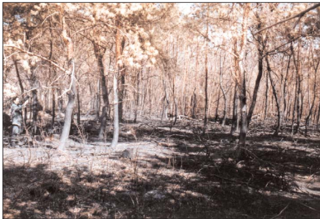
5. ábra: Leégett erdei fenyves 1997-ben (Sajókápolna 7 C)