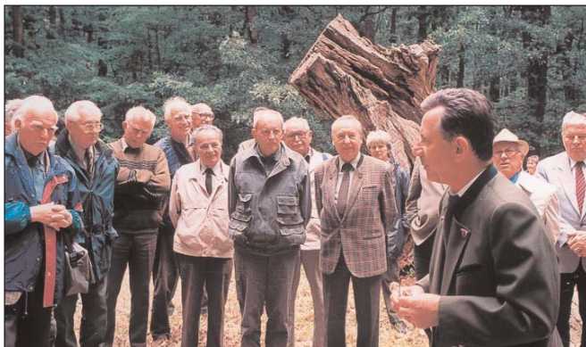
Bedő- és Kaán-díjasok Farkaserdőn

Címképünk: Államalapító Szent István szobra a budafai arborétumban.