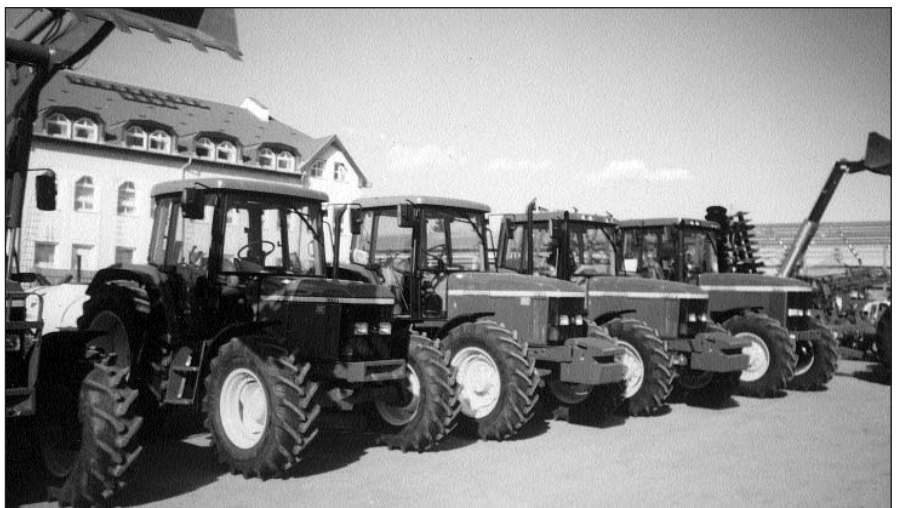
John Deere traktorok a KITE Rt. telepén