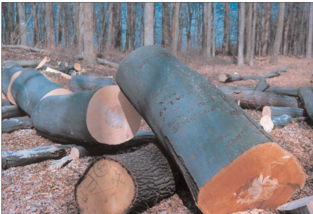
Vágásterület a zalaegerszegi erdészet területén.

– Most azokra nincs igazán időm, de előrehaladtunk a megyei Vadászati Almanach összeállításával. Ebben több írásom is megjelenik majd. Ez a kiadvány nagyszerű kezdeményezés. Úgy tudom tizennégy megye készíti el a millennium emlékére, és várhatóan az utókor legnagyobb öröme.