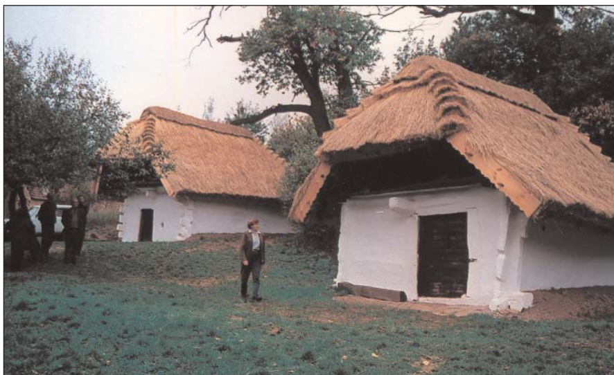
A cáki pincesor

tárvár volt, ALIAS GÜNS, s polgárai maguk is németek voltak, és ettől lett a két ház neve Stájer-házak.