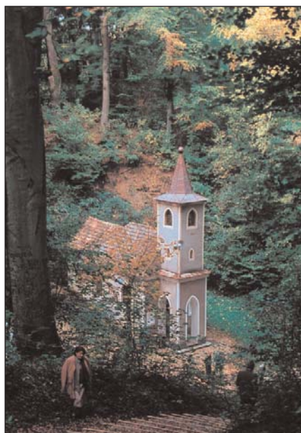
A Szent Vid kápolna