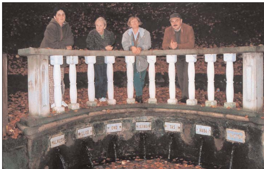
A Hétforrás fölött