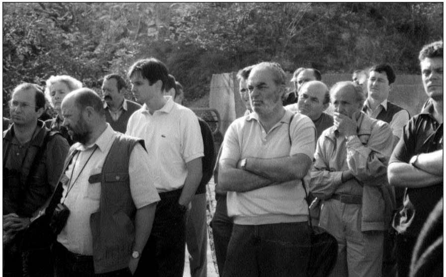
A csoport a Cserna-völgyről hallgatja az ismertetést

Az Országos Erdészeti Egyesület Erdőművelési Szakosztálya, a PRO SILVA HUNGARIA közhasznú társadalmi szervezet és az Állami Erdészeti Szolgálat Egri Igazgatósága szervezésében két autóbusznyi, a természet szerű erdők iránt érdeklődő 88 kolléga (erdőgazdálkodó, tervező, felügyelő, oktató, természetvédő, botanikus) vett részt 2000.