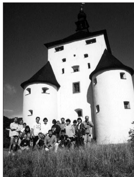
A selmecbányai Leányvár előtt

Az ászóthalmi Bedő Albert Erdészeti Szakiskola tanári kara – a Szakképzés 2000 Alapítványhoz benyújtott sikeres pályázata támogatásával – a családtagokkal kiegészülve 2000. július 9–13. között tanulmányutat szervezett Szlovákiába. Céljaink között szerepelt az ország néhány kiemelkedő természeti értéke mellett a múlt század végén alapít-