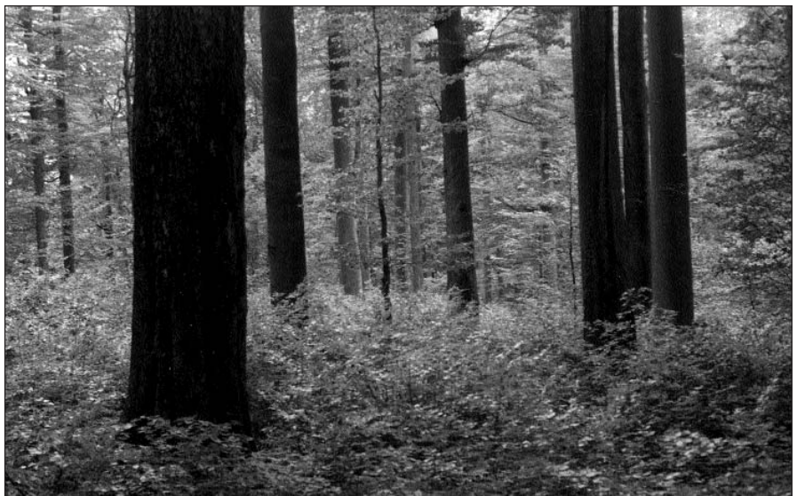
Újulatolt folt az őserdőben