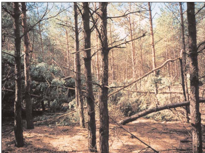
Erdőkár a Kiskunságban

Címképünk: A „Magyar Erdészeti és Vadászati Műszaki Segédszemélyzet Országos Egyesülete” zászlódíszje. Cikkünk a 356. oldalon.