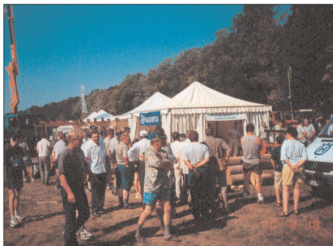
Erdészeti szakkiállítás a káldi Farkaserdőben

Címképünk: Erdők Hete 2000.