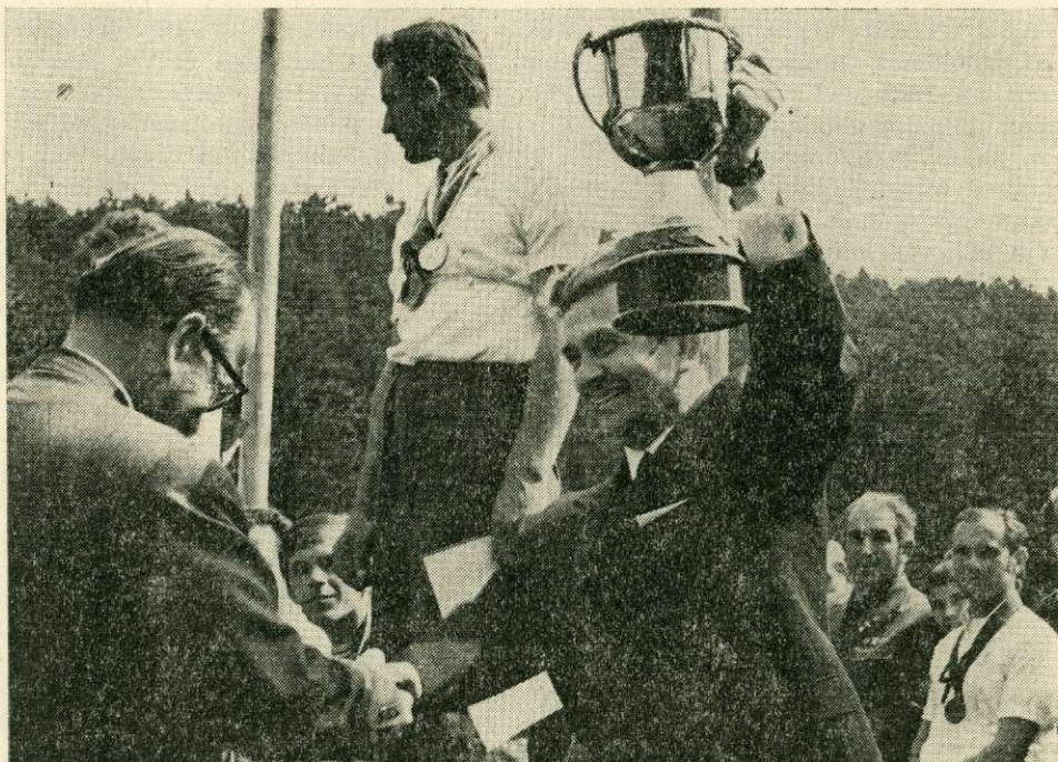
1972-ben a vándorserleg átadása a győztes magyar csapatnak.

szövegezte. A jelenlevők azt elfogadták. Az alapszabályban a következő legfontosabb kérdések kerültek rögzítésre: