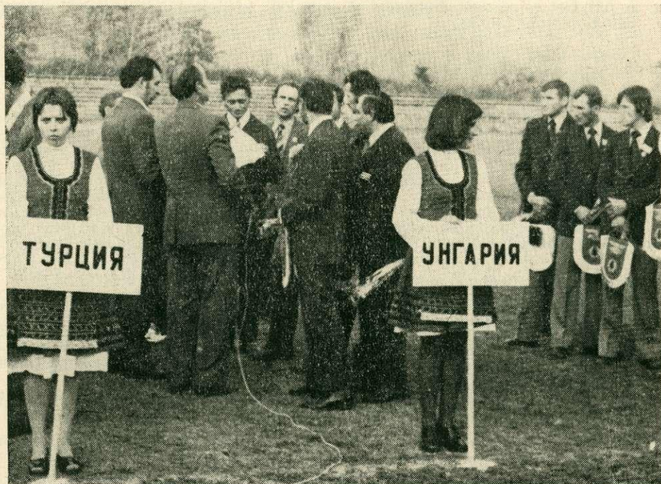
A Szovjetunióban 1975-ben ezüstérmes magyar csapat tagjai a rádióknak nyilatkoznak

Magyar részről úgy értékeljük, hogy az eddigi versenyek sikere nem egyes országok és nemzetek érdeme. Ezt közösen segítette elő minden olyan ország és szakember, akik közreműködtek a versenyek rendezésében, akik ezekre a versenyekre eljöttek és akik javaslataikkal segítették a pozitív irányú fejlő-