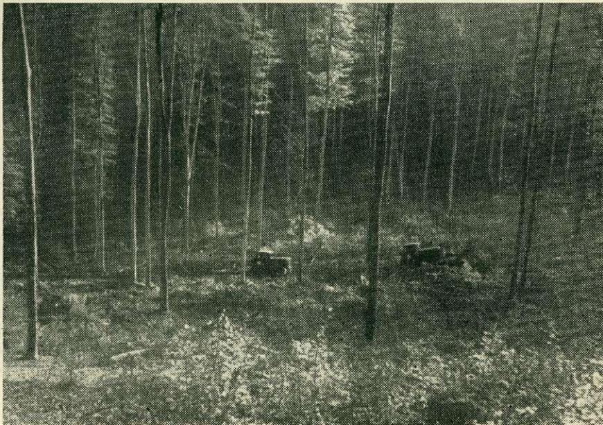
Közelítés Sztalinyec-tractossal. („A magyar erdészet tíz éve” fényképpályázaton I. díjat nyert kép.)

A munkafegyelem és technológiai fegyelem fokozatosan megszilárdult a fahasználat munkaterületén. Fakitermelő, közelítő, felterhelő dolgozók és azokat irányító szakemberek körében a tervek teljesítésénél mind jobban kialakult a fegyelmezett munkastílus. A fahasználat e fejlődésével kezdi betölteni a népgazdaságban kijelölt szerepét. A már eddig elért eredményei alapján a véghasználati termelést a kapitalisták által elhagyott, feltáratlan és nehéz körülmények között termelhető területekre helyezte át a jó fejlődésben levő középkorú állományok kímélése érdekében. Az előhasználatok arányának szabályozásával elérte, hogy még a felszabadulás utáni években 10—15%-ot képviselő előhasználati fatömeget 35—40%-ra, ugyanakkor az iparifakihozatalt 16%-ról 38%-ra emelte.