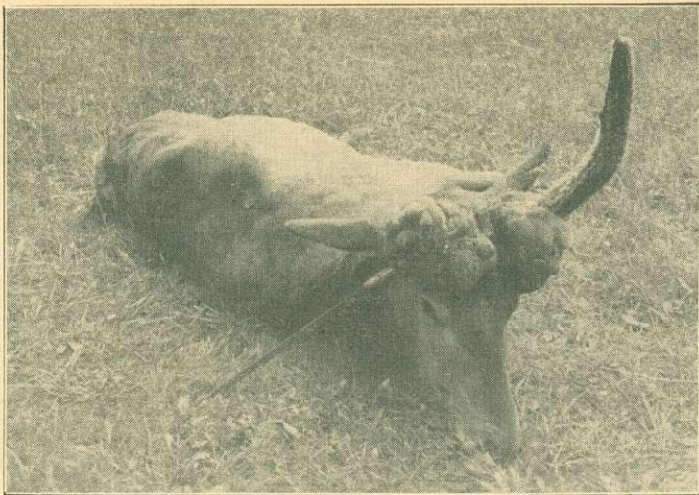
1. sz. kép. A műegyetem soproni tanulmányi vadászterületén lőtt parókás bika. (A fejét vasrúddal támasztottam fel.)

erdőben, a hátulsó lábára sántít, húzza mereven maga után, tehát többen kell lennie a hibának. Már akkor kiadtam a vadőröknek és az erdőőröknek a rendeletet, hogy aki találkozik vele, lőjje meg még tilalmi időben is, vállalom érte a felelősséget, hiszen bűn, ha az ilyen bikát hagyjuk, hogy apránként pusztuljon el, kigyógyulásra semmi remény.