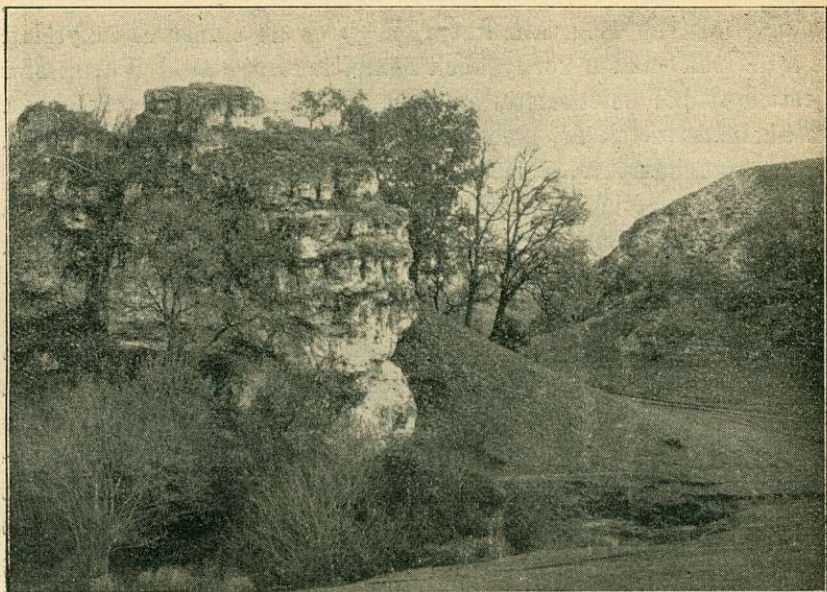
Tekercsvölgy részlete, sziklával.