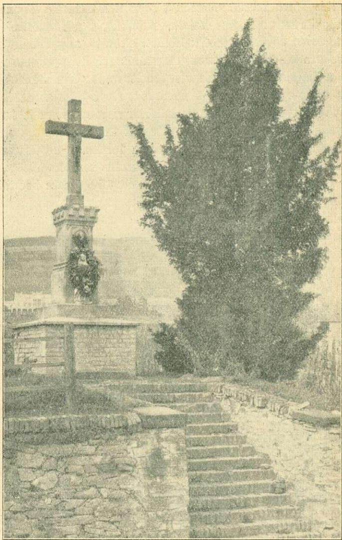
Tiszafa a csopaki szőlőkben, 83 cm. mellm. kerülettel, famagasság 7 m.

A szigorú erdészeti rendelkezéseknek kedvező hatásáról a helyszínen magam is meggyőződtem és azt tapasztaltam, hogy a kevésbé elcsenevészedett törzsek máris kezdenek rendbejönni és számtalan helyen egészséges újulat is mutatkozik.