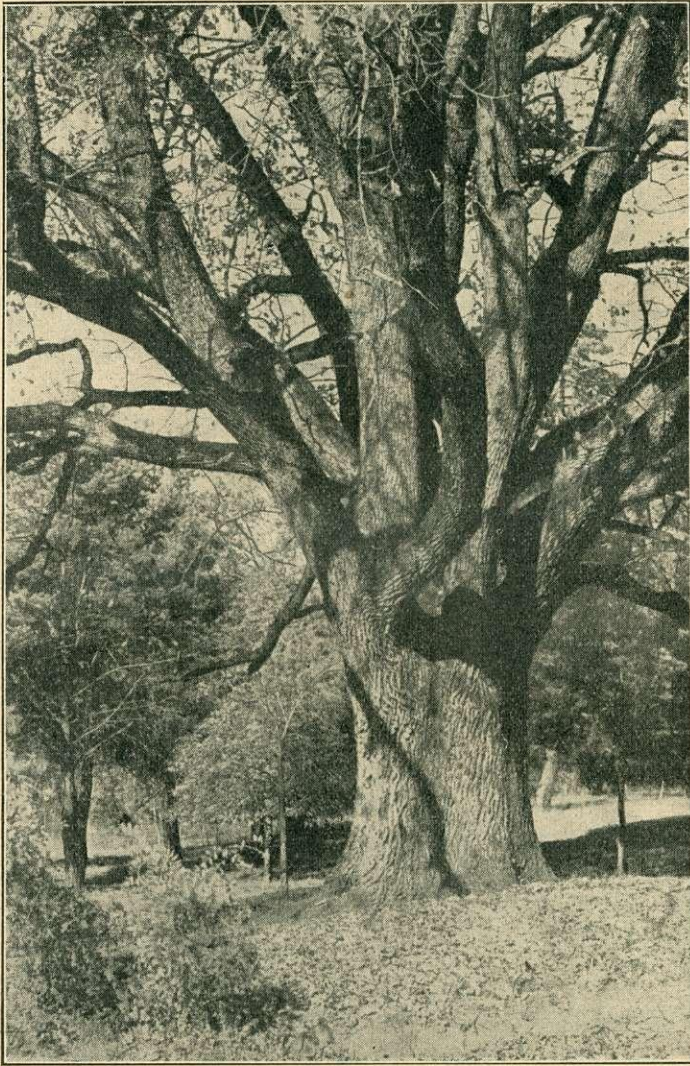
A betyár Patkó Bandi tölgyfája Középrigócon.

nek cementtel való kitöltésével igyekeznek azok életbenmaradását biztosítani.