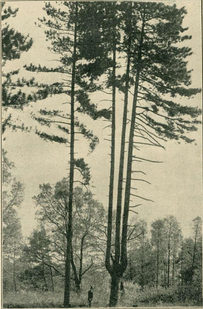
Középrigóci lantalakú fenyő.