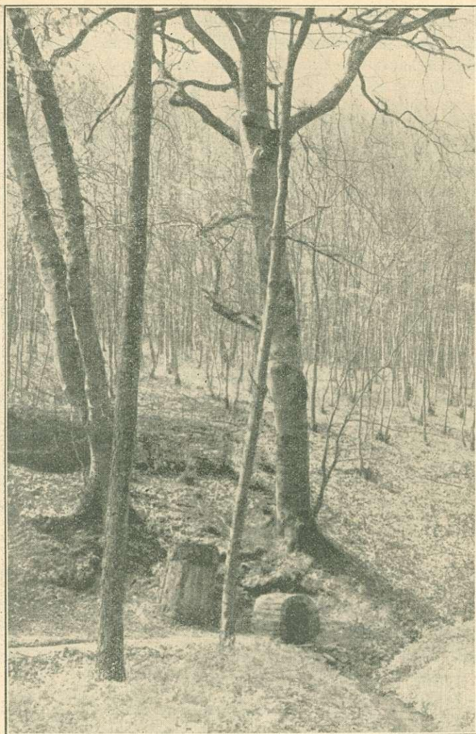
Kis rezerváció az „Isten kútja”-val és két öreg bükkfával Esterházy hg. dinyeberki erdejében (Baranya m.).