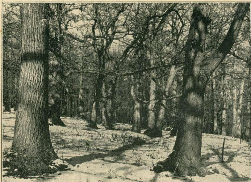
Pécs város gesztenyefaerdeje.

zöldmények fenntartásával még nincsen a cél teljesen elérve; ezeket is kíméletben kell ugyan részesíteni, de jóval fontosab- bak és tudományos szempontból is sokkal becsesebbek a külön- féle ritkaságokat magában foglaló, kisebb-nagyobb rezervációk kijelölése és fenntartása.