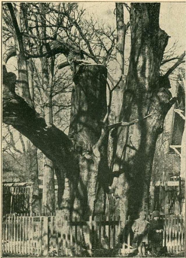
Az „Ezeréves gesztenyefa” Pécs-bányatelepen.

tagságban agyag, alatta részben szén, részben palarétegek, a legalsó rész pedig homokkő.