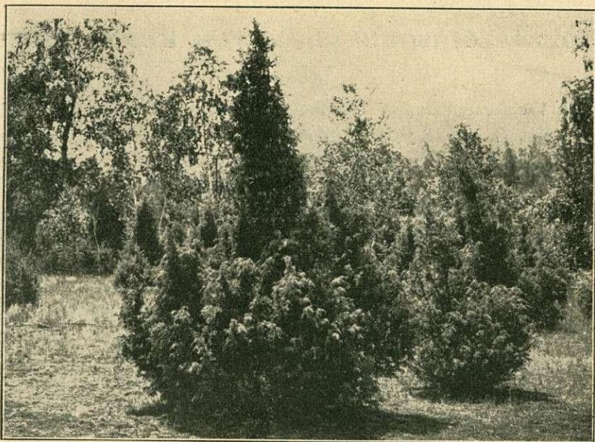
A rigóci liget. Futóhomokos vidék páfránnyal, nyírral és borókával.

mocsaras vidék, mely jellegzetes alacsonyvidéki termőhelye a tőzegmohának és kísérőinek.