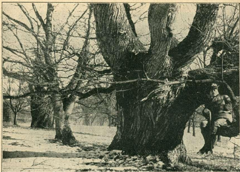
Gesztenyész részlete Zengővárkony határában.