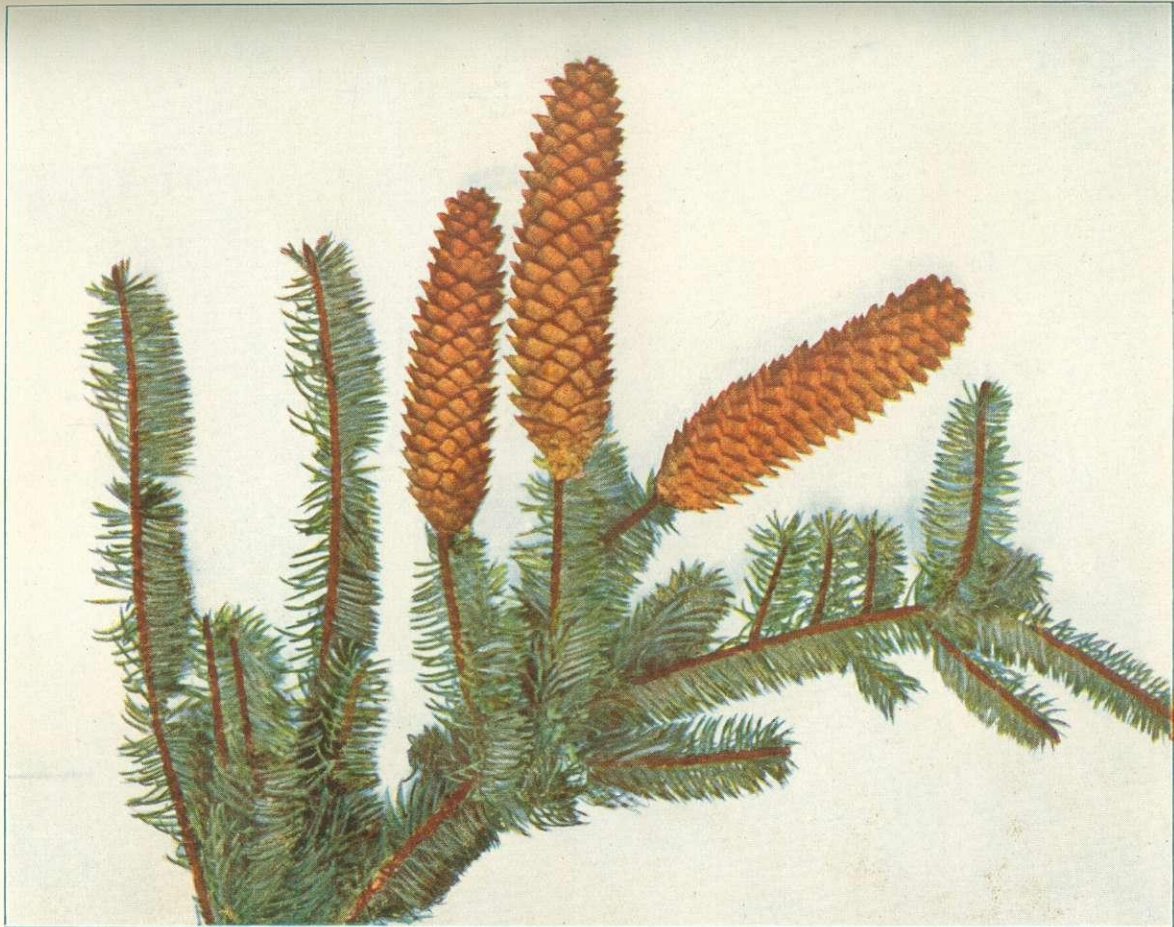
Picea excelsa var. glauca . \frac{1}{3} .