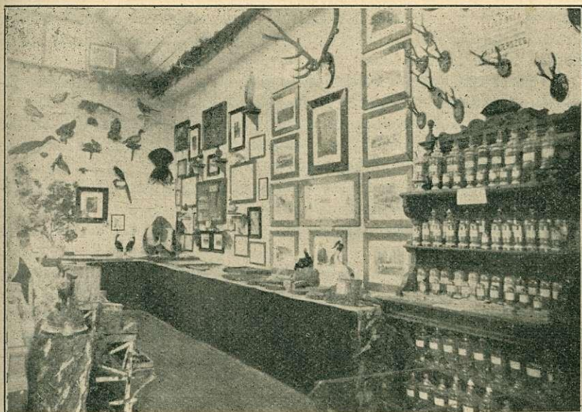
Részlet az erdészeti kiállításról.

8. Pécsi róm. kath. püspökség erdőhivatala Hosszúhetény, az anyagot gyűjtötte és rendezte Szporny Gyula főerdőmérnök (Márévár modellje felújítással és számos erdei termék stb.).