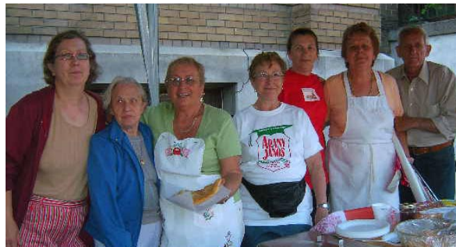
AMagyar Fesztivál törzscsapata