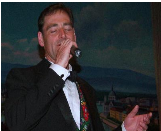
A Magyar Kultúrközpont elnöke kiváló előadóművész is