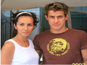
Akik a kürtöskalácsot sütötték