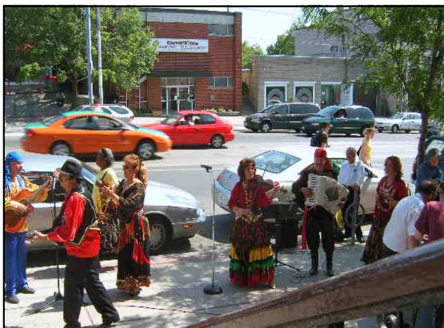
Magyar Fesztivál, 2007