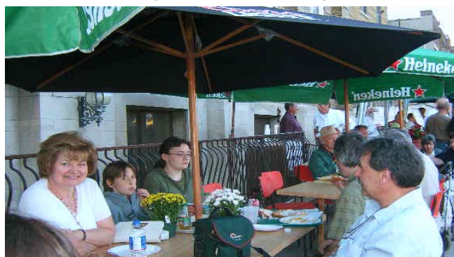
Jó hangulatban a Fesztivál látogatói