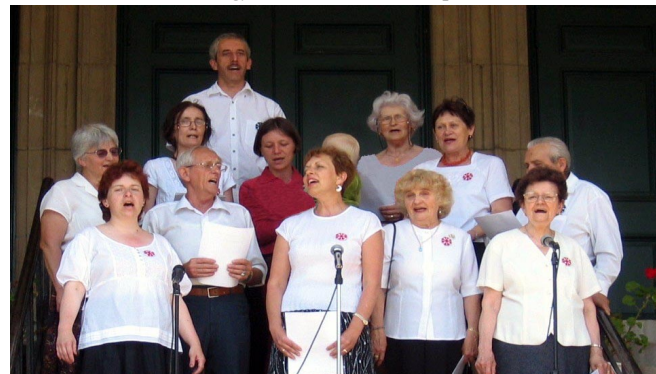
A Barsi Ernő Népdalkör