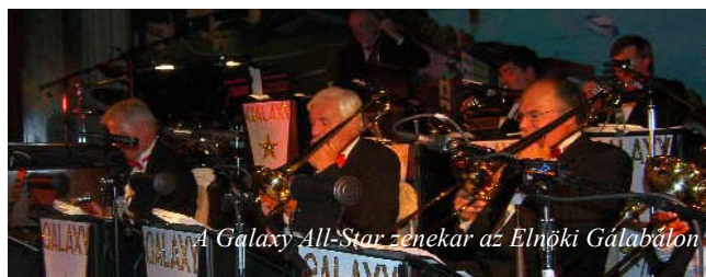
A Galaxy All-Star zenekar az Elnöki Galában