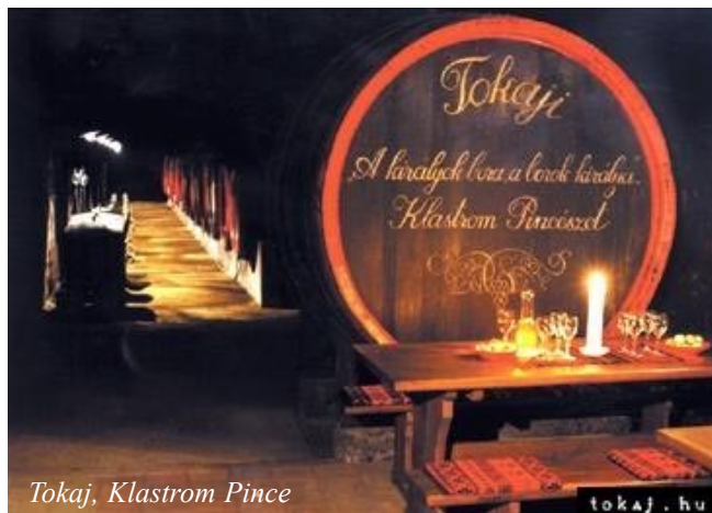
Tokaj, Klostrom Pince