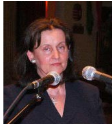
Képek a trianoni megemlékezésről