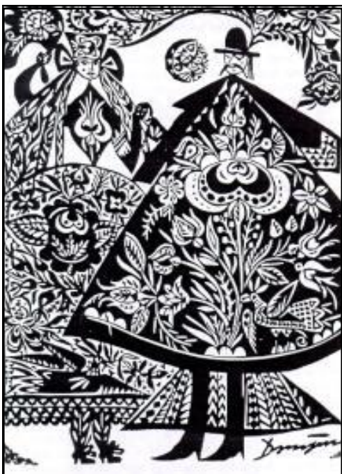
Domján József fametszete