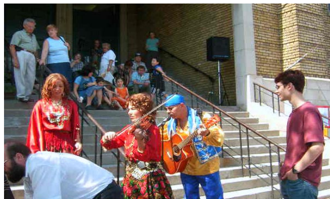
A Gypsy Flame