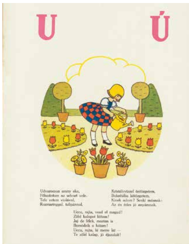
Oldal az Arany ABC-ből | A page from the Golden ABC

A Magyar Bibliophil Társaság által évente meghirdetett Szép Könyv díjra a könyveket a kiadójuk terjeszthette fel, s a versenyen könyvpiaci forgalomba nem kerülő magánkiadványok nem vehettek részt. 5 A díjazottakat december 10-én jelentették be – ezzel még a karácsony előtti könyvvásárlási kedvre is kihatva. Az elismerés (a hír reklámértékén túl) semmilyen anyagi díjazással nem járt, csupán renoméja révén elegendő vonzerővel bírt a kiadók számára, hogy nagyobb verseny alakulhasson ki.