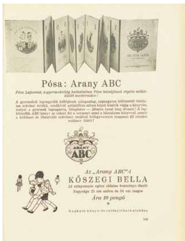
Az Arany ABC hirdetése Advertisement of the Golden ABC