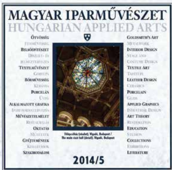
A Magyar Iparművészet 2014/5. számának címlapja. Terv: Tandem Grafikai Stúdió | Cover page of Issue 5/2014 of Magyar Iparművészet / Hungarian Applied Arts. Design by Tandem Graphic Design Studio

lapszámainak borítóján feltűnt, majd húsz éven át megjelent, az iparművészeti alkotóterületek megnevezését és az ágazat szervezeti és intézményrendszerének egységeit mintegy tartalmi leltárként összegző felsorolás: ötvösség, fémművesség, belsőépítészet, környezettervezés, bútór, díszlet, játék, textilművészet, gobelin, öltözködés, ruha- és jelmeztervezés, bőrművesség, kerámia, porcelán, üveg, könyvművészet, plakát, reklámtervezés, ipari formatervezés, művészetelmélet, kritika, restaurálás, diplomázók, művészportrék, műhelyek, gyűjtemények, gyűjtők, kiállítások, szakirodalom.