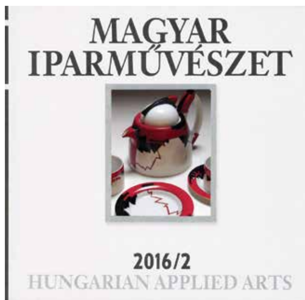
A Magyar Iparművészet 2016/2. számának címlapja. Terv: Tandem Grafikai Stúdió | Cover page of Issue 2/2016 of Magyar Iparművészet / Hungarian Applied Arts. Design by Tandem Graphic Design Studio