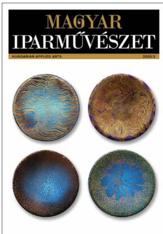
A Magyar Iparművészet 2020/2. számának címlapja. Arculatterv: SCHERER József, grafikai tervezés: NAGY Norbert | Cover page of Issue 2/2020 of Magyar Iparművészet / Hungarian Applied Arts. Magazine identity design by József SCHERER, graphic design by Norbert NAGY