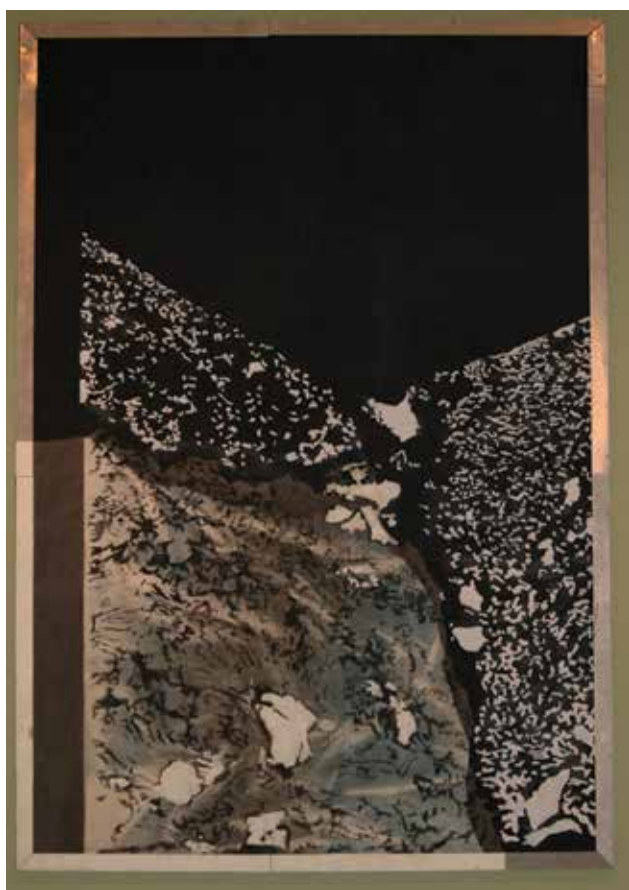
BAJKÓ Anikó: Helyszínrajz | Anikó BAJKÓ: Site plan 1976, vászon, festett, 217x151 cm

A sokszínű, különböző műfajú alkotótelepi munkákról a képtár falain fotó és dokumentáció látható, olvasható, az akció, a performance és az installációs térélmények sajnos már csak a résztvevők emlékeiben élnek. Az akkor készült videófelvevételek technikai okokból ma már nem játszhatók le.