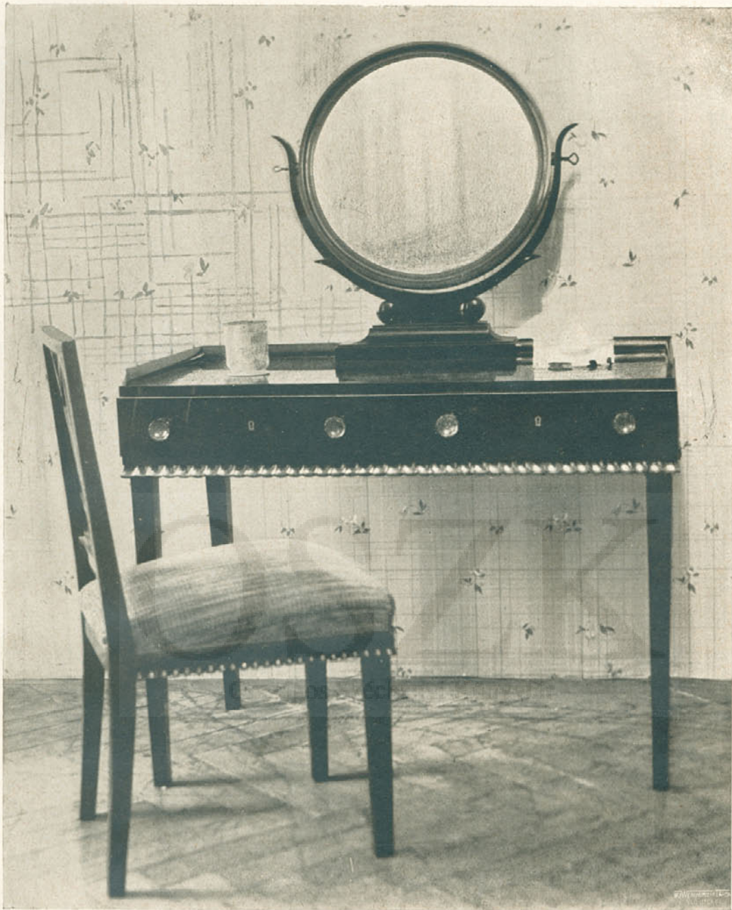
Az IOKSz. és az O. M. Iparművészeti Társulat lakásberendezési kiállításából. Hálószoba tükrösasztala és szék. Tervezte Schalamonek Károly. Készítette Mayhen Ferenc. — Frisiertisch und Stuhl. — Table de toilette et chaise.