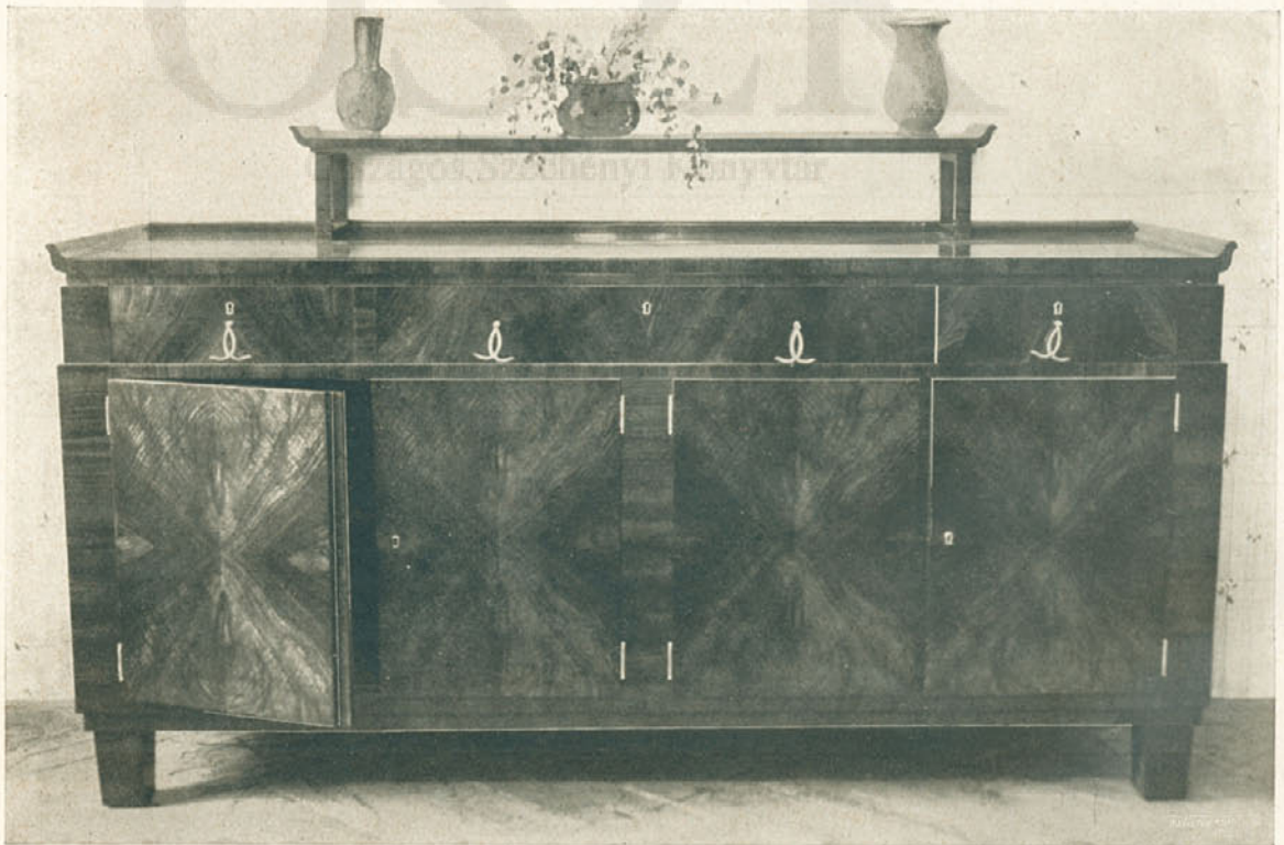
Az IOKSz. és az O. M. Iparművészeti Társulat lakásberendezési kiállításából. Tálaló és pohárszék. Tervezte Schaefer Ferenc. Készítette Kíszelák János. — Speisezimmermöbel. — Table de service et buffet.