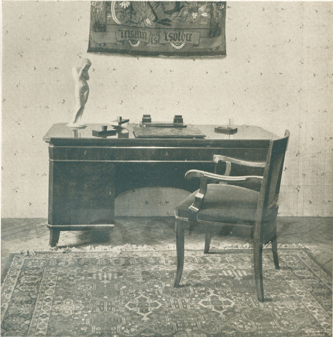
Az IOKSz. és az O. M. Iparművészeti Társulat lakásberendezési kiállításából. Iróasztal és szék. Tervezte Flach János. Készítette Szócs István. — Schreibtisch und Stuhl. — Bureau et fauteuil.