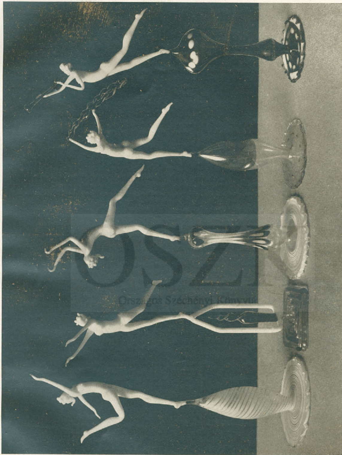
Komáromy István: Forrasztólámpán szabadon formált üvegfürák. Készültek a Széchényi Export műhelyében. — In der Lötflamme freimodellirte Glasfiguren. — Figurines en verre.