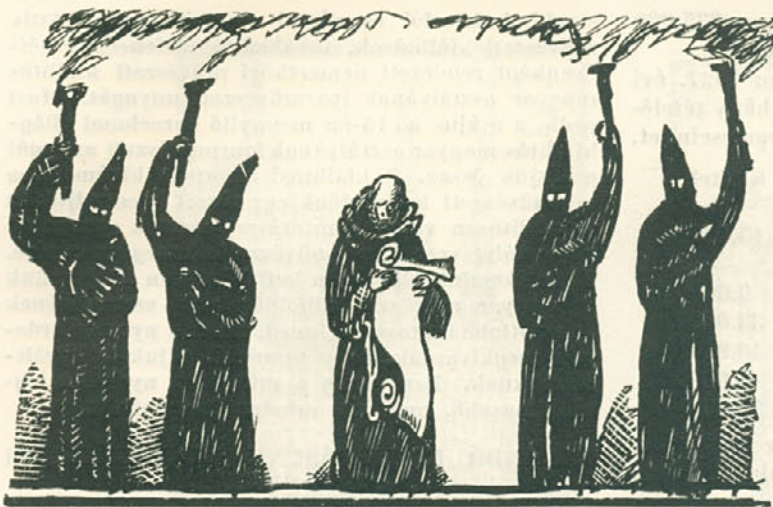
Vértés Marcel fametszete.

az előző évekéit, ami elég biztató eredménynek vehető. Megemlítjük még, hogy a lefolyt nyár folyamán részt vettünk a szombathelyi országos kiállításon és karácsony előtt a miskolci gör. kath. négyesület által rendezett iparművészeti kiállításon. Mindkettő kielégítő anyagi eredménnyel járt.