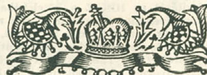
Gróf József fametszete.

Nem az egyik-másik művészeti irány támadói az el-lenségek; hiszen azzal, hogy támadnak, bebizonyítják, hogy érdekli őket a művészet. A legveszedel-mesebbek a közömbösök, akiknek minden mindegy.