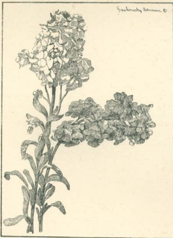
Orsz. m. kir. iparművészeti iskola. Grafikusok osztálya. Tanár: Helbing Ferenc. Virágtanulmány.

Éppen ily sajátos és feltűnő jelenség, hogy az utolsó évtizedek iparművészete nagy figyelmet fordít olyan nemzetek munkáira is, amelyek nagyobb kulturális kérdésekben és nemzetközi politikai téren alig szerepelnek. Észlelhető ugyanis, hogy azokban az országokban, ahol a végtelékig keresztül vitt munkamegosztás, a tömegtermelés még nem,