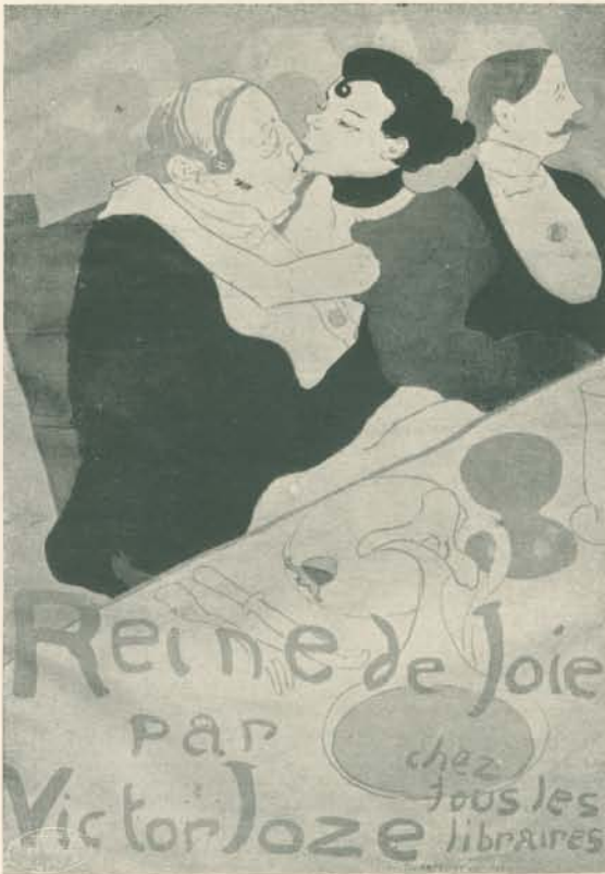
H. de Toulouse-Lautrec.