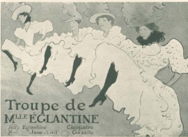
H. de Toulouse-Lautrec.