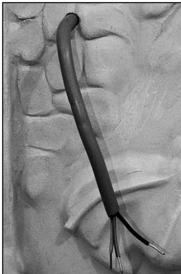
Jánosi László: Szenteltvíztartó