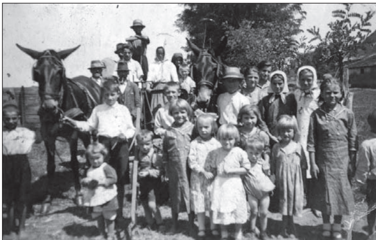
Az egykori lóré Konstanciamajoron

kotárkák, fészerek, kutak stb. Később volt itt iskola, templom, táncterem és olvasóterem. Konstanciamajor kétdűlőnyi 10 volt, alsó és felső majorból állt. Az alsó majorban két lakás volt, melyben négy család lakott, valamint itt történt a disznótenyésztés, itt voltak a disznóólak. A felső major adott helyet a többi épületnek, így a kápolnának is (SZALMA). A két elkülönült egységet jól szemlélteti a harmadik katonai felmérés térképe, amelyen jól látható, hogy a két majorrészt egy tisztás köti össze, ennek közepén pedig egy kút van. Konstanciamajor a nagyobb központok közé tartozott (A Monarchia III. katonai felmérése 1910).