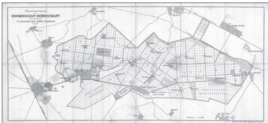
A zsombolyai uradalom 1897-ben

A növénytermesztés terén legfontosabbak a gabonafélék, majd a cukorrépa és a kender voltak. A két utóbbi a torontáli gyárakban került további feldolgozásra, a cukorrépa az 1910-ben megnyitott nagybecskereki cukorgyárban, míg a kender az uradalom kendergyárában, mely az egyik majoron volt. A birtok állattenyésztésében legfontosabb helyet a tehenészet foglalta el. A tejet Temesváron és Zsombolyán értékesítették, valamint vajból is jelentős mennyiséget állítottak elő, szintén az egyik majoron lévő tejgyárban (BOROVSKY 1911: 227).