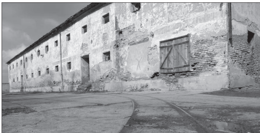
A júliamajori gabonaraktár mai állapota és a lóré nyomvonala

tott istállóban pedig az egykori földműves-szövetkezet munkásai és családjaik élnek. Ez azon ritka helyek egyike, vagy az egyetlen hely, ahol még megmaradt a „lóré” egy rövid szakasza, mintegy mementóként.