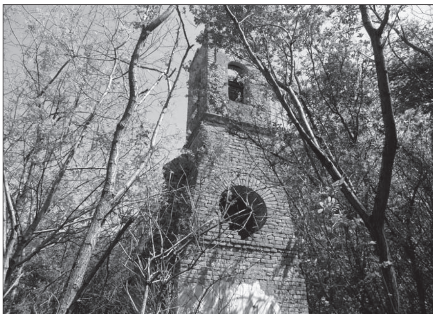
A templom romjai Konstanciamajoron napjainkban

A XIX. század folyamán az uradalmi majorok képezték azt az innovatív gazdasági húzóerőt, amely előbbre vitte a bánáti mezőgazdasági termelést. Érdekes szociális, illetve településszervezési vonzata is volt a majoroknak, lévén, hogy nemcsak cselédlakások, hanem esetenként templomok, iskolák is létesültek ott a cselédség, illetve a mezőgazdasági munkásság számára. A majorokon való gazdálkodás és élet csakúgy, mint számtalan más „rég”i” dolog, eltűnőben van, nagy része már el is tűnt. A Csekonicsok nagyszámú, igen gazdag épületállománnyal rendelkező majorja közül csupán Júliamajor tanúskodik a valamikori időkről. Az írott és térképi források segítségével rekonstruálható még az egykori kép, s az egykori lakosok szintén hasznos információkkal szolgálhatnak. A tárgyi bizonyítékok, vagyis az épületek viszont a legtöbb esetben, Júliamajor kivételével, nem alakultak át, nem kaptak új külsőt, új rendeltetést, hanem teljesen megsemmisültek a XX. század második felében, és ezzel az épületállománnyal együtt eltűnt az effajta életvitel is, vagyis a település- és lakókultúra egy része.