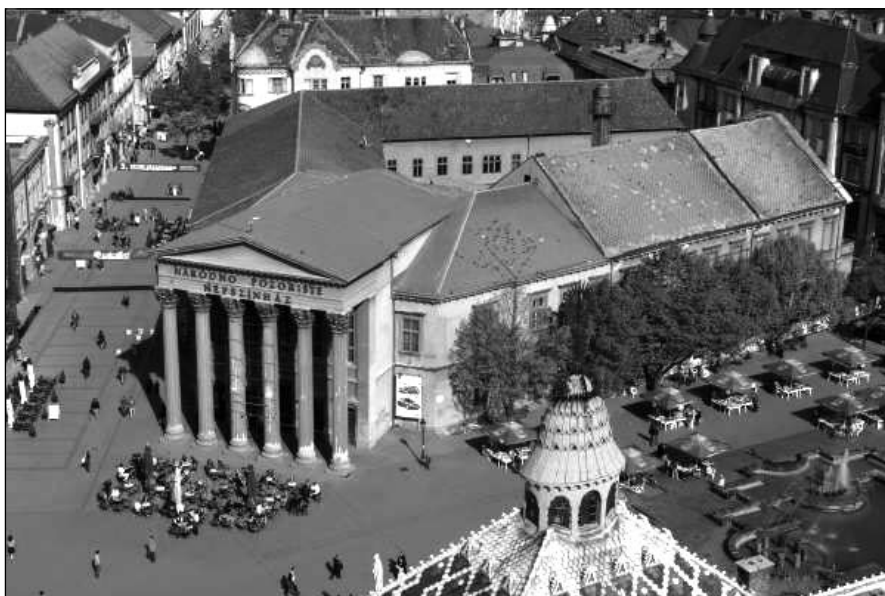
2. kép: A Népszínház épülete, melyet 1854-ben építettek, s 2007-ben romboltak le