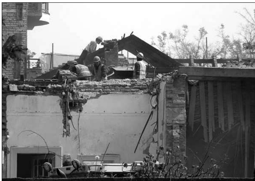
4. kép: A Raichle Ferenc 1899-ben épített szecessziós stílusú épületének lebontása