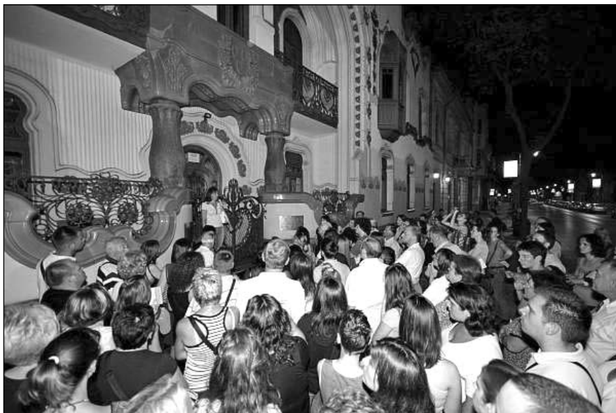
6. kép: A Mosolyogjon Szabadkára oktatószéna egyik állomásán