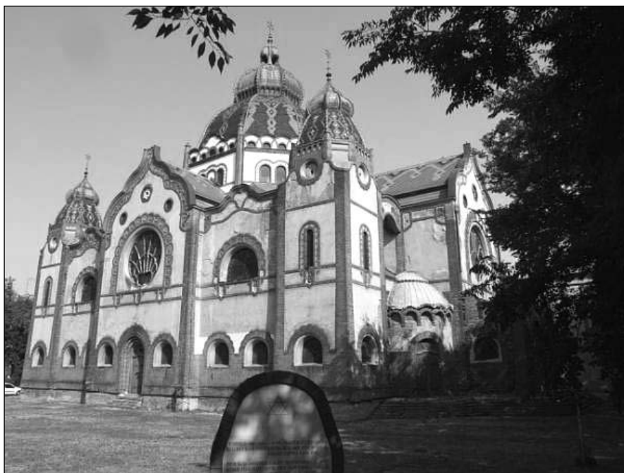
1. kép: Az 1912-ben épített Zsinagóga