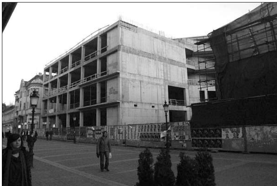
3. kép: Az új színház beton-csontváza