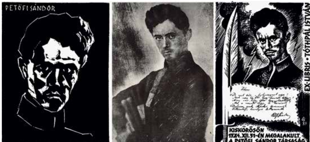
3. ábra. Petőfi Sándor alakjáról fennmaradt dagerrotípia (középen), Andruskó Károly fametszete (balról), Csutak Levente linómetszete, 1985 (jobbról)

a történeti, tárgyi világ is, amelyben Petőfi élt és alkotott, máskor valamely költeményének motívumvilága nyer képi megjelenítést. Több ex libris Petőfi leghitelesebb mellképét, a dagerrotípiát idézi. Ez a költő alakjának tükörképét mutatja sötét ruházatban, magasan záródó zsinóros atillában és a nyaka köré tekert hosszú nyakkendőben, jobb karjával egy biedermeier székre támaszkodva. (3. ábra)