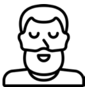
Gen X '65-'80