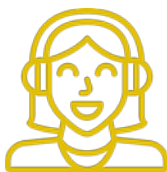
Gen Y '81-'99

Optimista Idealista Munkamániás Stabilitás Szava parancs