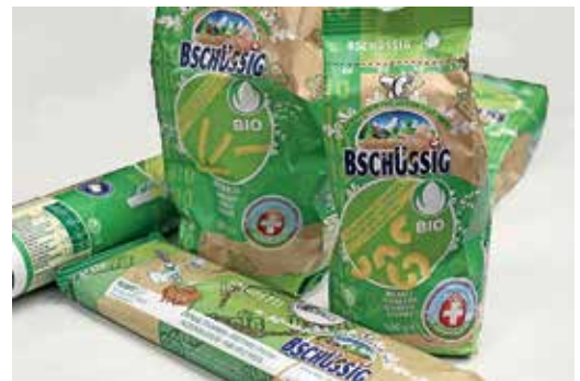
A svájci Bschüssig gyártó zöld csomagolásonyomatott tasakokba van csomagolva. (Forrás: pack.consult)

Az olaszországi Cremosano városában található ACM csomagolóanyag-gyártó esetében a csomagolás digitális nyomtatásának oka a példány-