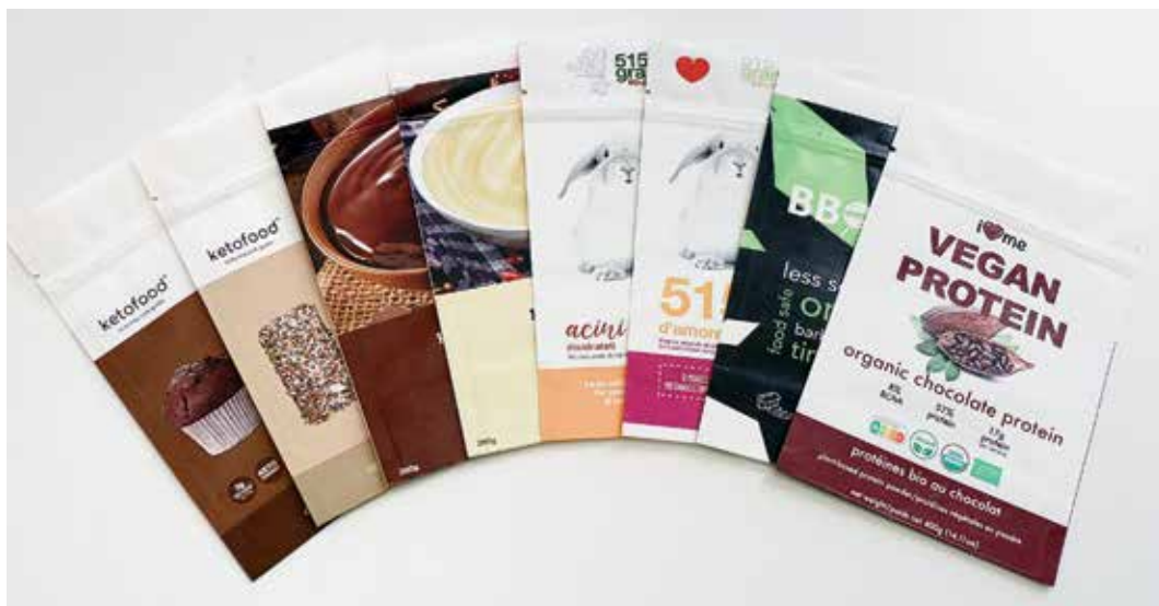
Az ACM digitálisan nyomtat kis példányszámokat visszazárható zacskókból TITON száraz tonerrel.

számokban keresendő. Az ACM az elsők között használt Xeikon CX500t berendezést kis példányszámú tasakok gyártására. A cég értékesítési stratégiájának egyik alapköve a száraz tonerrel nyomtatott papírtasakokkal kapcsolatban, hogy élelmiszer-biztonsággal és fenntarthatósággal bírnak.