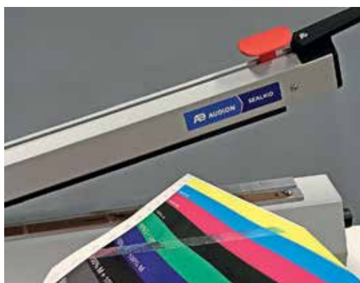
A TITON száraz festékkel ellentétben a hagyományos száraz festékrétegek nem rendelkeznek kellő hővel szembeni ellenállással a hajlékony csomagoláshoz való használatra.

A szálal anyagokból készült csomagolási megoldások azonban a rugalmas csomagolások terén is egyre terjednek, új feladatokat kapnak, és nem csak a magas újrahasznosítási arányuk miatt, vagy azért, mert megújuló forrásokból készülnek.