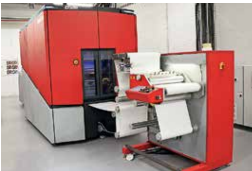
A Xeikon CX500t LED-es térhálósító egységgel is rendelkezik a TITON toner térhálósításához.

A nyomdagépbén végzett leképezési folyamat után a látenis képet átviszik a nyomathordozóra, majd a részecskéket hozzávetőleg 110 °C hőmérsékleten rögzítik a hordozóhoz. A festékrészecskék megolvadnak és koagulálnak, így homogén filmet alkotnak, amelynek vastagsága akár kb. 4 µm festékrétegenként. Ezenkívül a Xeikon CX500t digitális nyomdagép LED-es térhálósító egységgel is fel van szerelve. A LED-sugárzás beindítja a festékpolicimerek térhálósodási folyamatát. Végül az összes TITON toner polimert térhálósítják, hogy egyedi tulajdonságokkal rendelkező mátrixot képezzenek. Mivel a tonerréteg molekulatömege és a mátrix szerkezete, amelybe a komponensek be vannak ágyazva, a döntő tényezők a migrációs viselkedésben, a poliészter rétegben lévő komponensek gyakorlatilag mozdatlanok. Emiatt a száraz festék migrációs kockázata rendkívül alacsony. Ez egyedülálló a digitális csomagolásonyomatásban, különösen azért, mert a tömör réteg teljesen szagtalan, a nyomtatás előtt is teljesen szilárd és biztonságosan kezelhető.