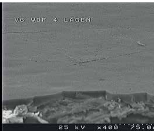
A TITON száraz festék alkotórészei nagymértékben megnagyobbodtak (balra), és beleolvadtak a poliésztergyanta nyomtatott rétegébe (jobbra).

egyik megközelítése a monofilm-laminátumok vagy az orientált polietilénből (MDOPE) készült monofilmek alkalmazása, amelyekre a kialakítástól függően hátoldali vagy frontális nyomtatásban zárófehéret és oxigénzáró lakkot visznek fel. Ezzel a szerkezettel figyelemre méltó oxigénátbocsátási sebesség (OTR) értékek érhetők el az oxigénáteresztő képesség tekintetében, ami már a különféle zsíros ételekkel szemben támasztott követelmények széles skáláját fedi le.