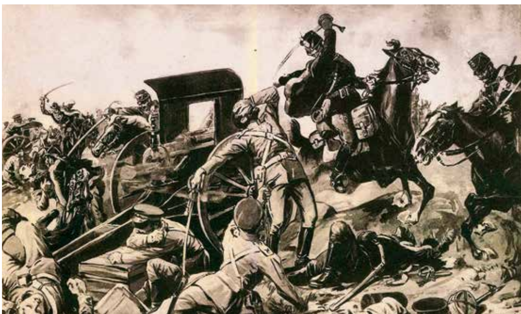
Huszárjaink vakmerő támadása ... – A világháború képes krónikája folyóirat, 1914. december 6.