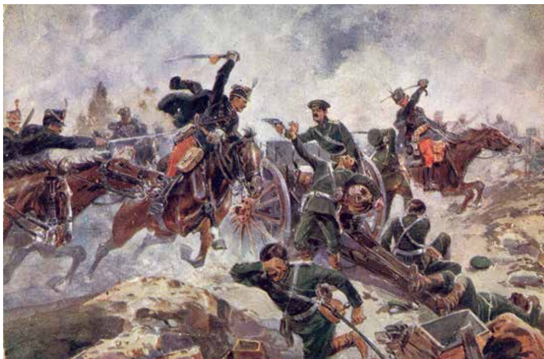
Huszárok támadásban – Képeslap (Nádasdy Ferenc Múzeum, Sárvár NFM-T 66.47.462)

és határon túli tájakat, városokat ábrázoló levelezőlapjai nemcsak itthon, de a Monarchia más területein is népszerűek voltak, a BKWP kiadó által még a tengeren túlra is eljutottak.