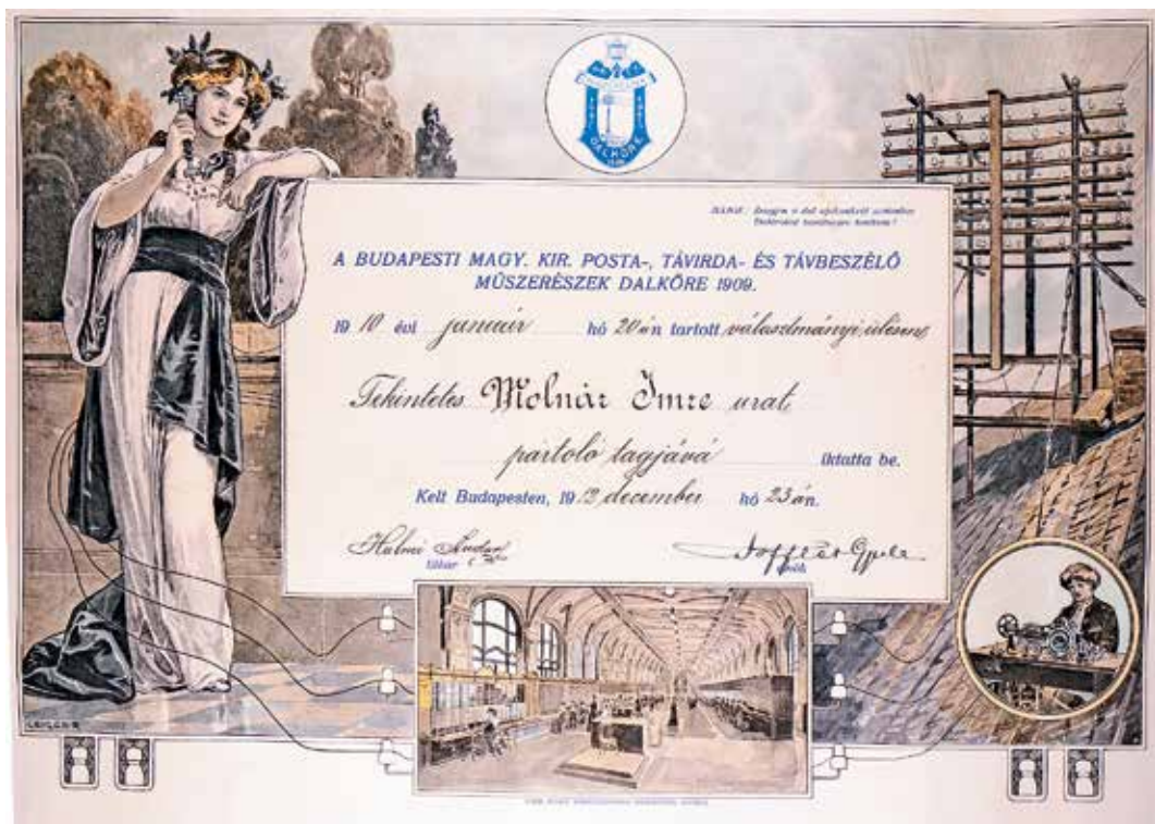
Oklevél – A Budapesti Magy. Kir. Posta-, Távirda- és Távbeszélő Műszerészek Dalköre, 1909 (Bedő-gyűjtemény)

zott grafikai munkái a Kner Nyomdában 1909–1916 című időszakos kiállítás, amely eredeti festmények, grafikák és nyomdatermékek segítségével mutatja be a csaknem egy évtizedes együttműködés remekeit. Kner Izidor figyelmét a Trencsényi Körjegyzői Nyomda által 1905–1906-ban kiadott meghívó mintafüzetekben lévő szecessziós báli meghívók hívhatták fel Geiger Richárdra. A kapcsolatfelvétel igen jól sikerült: a Röpke Lapok 1910. évi 5. számában megjelenő báli meghívó minták többsége már Geiger Richárd rajza, illetve festménye felhasználásával készült, az együttműködésük idején a nyomda által gyártott kb. 700 féle meghívóból pedig több mint a fele. A közös munkának a Kner Nyomda alkalmazott művészeti stílusának kialakításában is kiemelkedő szerepe volt: a szecesszió, a neoreneszánsz, illetve William Morris stílusjegyeinek követése átmenetet jelentett a Kozma-féle illusztrációkkal jellemezhető későbbi stíluskorszakba.