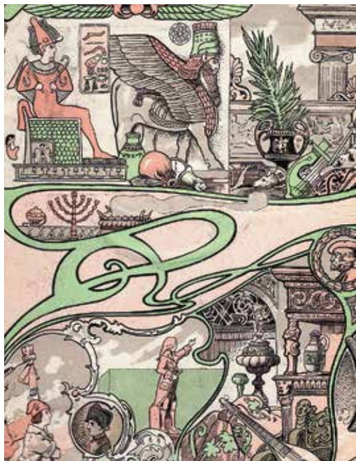
Előzékgrafika részlet – A világ történelme című könyvsorozat, szerk. Endrei Zalán, Globus Műintézet és Kiadóvállalat R.-T., Budapest, 1906