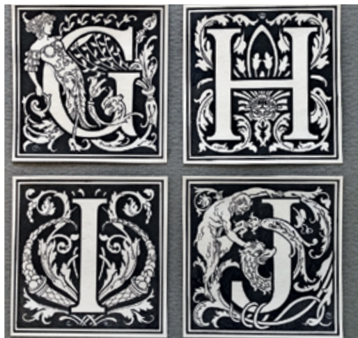
Iniциálé, forgalmazó: lipcsei Numrich betűöntőde – Kner Imre: Könyv a könyvről , Kner Izidor Könyvnyomdai Műintézet, Gyoma, 1912

lámplakátokat, emblémákat, jelvényeket stb. Az Alkoholelles plakát versenyre beküldött munkájával 1912-ben a verseny díját is elnyerte.