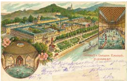
Képeslapok az 1900-as évekből – Sorgente di Loser János Budaörs, Budapest; Üdvözet a Császár Fürdőből, Budapest (Bedő-gyűjtemény)