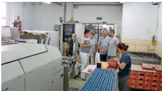
Gyomai Kner Nyomda