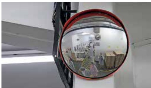
Marzek Kner üzemlátogatás