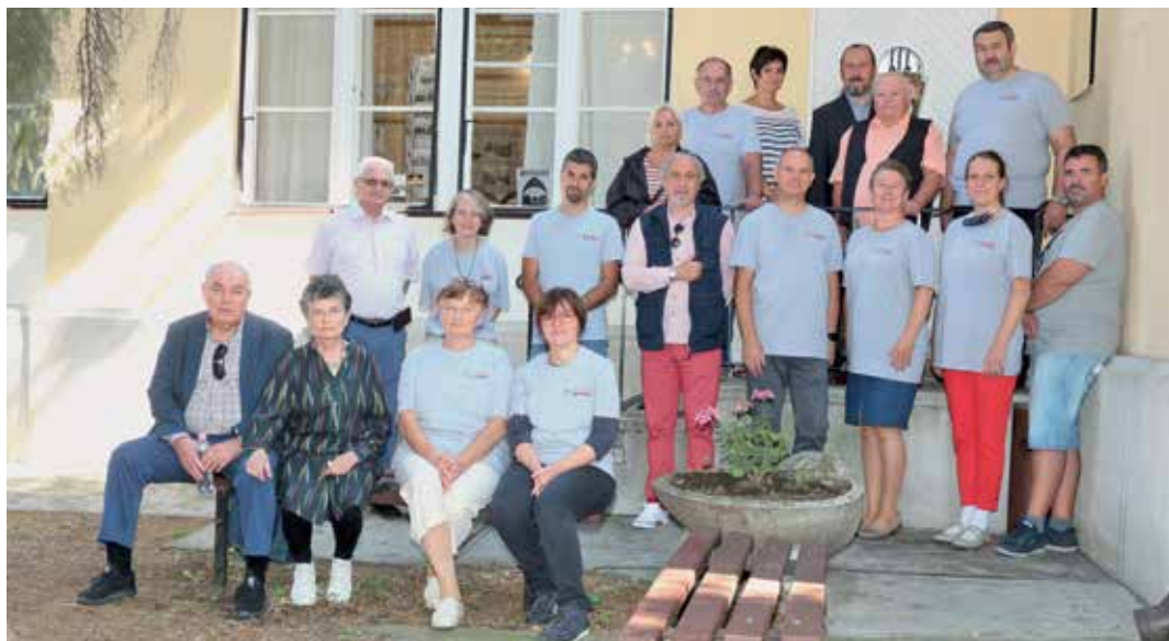
A Kner ház előtt a Magyar Grafika csapata