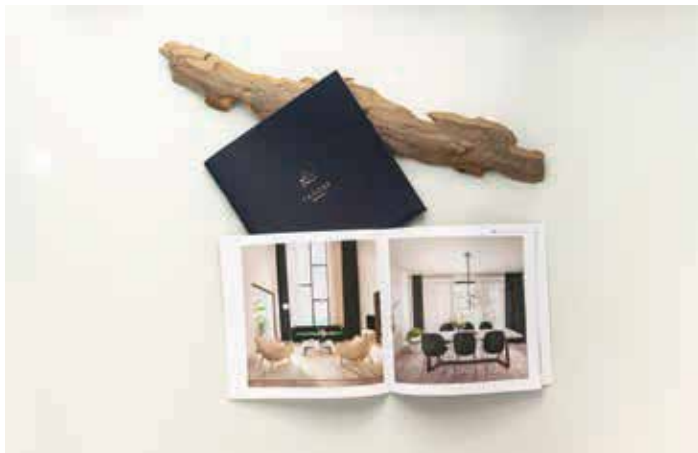
Tagore Residence lakóépület arculata

Ich bin vierzehn (ez hosszú, de igaz) Zwoelf – miért német, amikor a könyv: brandguide... vannak nyelvi elköteleződésed? A könyvre akár itt is ráfordulhatsz – az embléma rendben, a név magyarázatot kíván: fontos az, hogy mi a neve? Egy brandnél például? A Tibi csoki jobb, mint a Milka? Na jó, ez provokatív... de van-e szerepe (szerinted) a grafikusnak abban, hogy egy grafika/reklám milyen szöveggörnyezetet kap – Tibor Kálmán? – Akinek ismerjük a munkásságát.