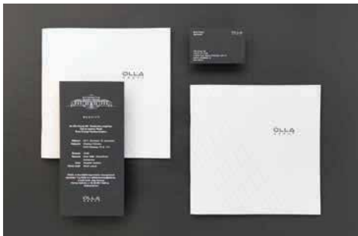
OLLA Group kiadványok, meghívók és kisarculat