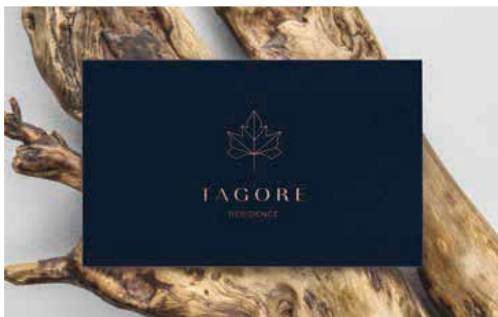
Tagore Residence lakóépület arculata

12-én születtem, fociztam és 12-es volt a mezszámom, 12-én kaptam meg a jogsimat és a sort még sorolhatnám. Valahogy a 12 fontossá vált az életemben, és amikor 2000 környékén az ügyvédnél álltam, hogy mi legyen a cég neve, akkor döntöttem, hogy legyen a németes zwoelf. Németül is folyékonyan beszélek az angol mellett, és akkoriban a német közelebb is állt a szívemhez. Egyébként a zwoelf nevet ma már biztos nem ajánlanám. Branding szempontból nem egy ideális választás a nehéz kiejthetőség miatt. Ellenben jó az emlékezeti értéke.