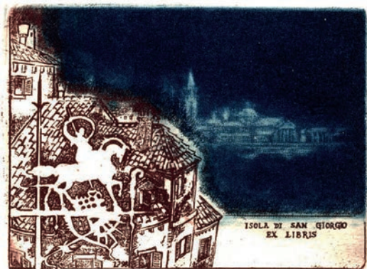
7. kép. Isola di San Giorgio ex libris (1998), 62 × 83 mm

Felidéződik például a 15–16. századi Aldus Manutius velencei humanista, nyomdász és kiadó, az Aldine Nyomda megalapítója portréja és nyomdászjelvénye. A 16. században működő Gerardus Mercator flamand térképész, a modern térképészet mestere arcképét a földgolyót tartó titán, Atlasz alakja egészíti ki. Ürmös Péter több ex librisén a rézkarc technikát aquatinta eljárással egészítette ki, ezzel érve el különböző tónusú, árnyalt, foltszerű hatást. A kisgrafikák közül kitűnnek azok, melyek változatos színkezeléssel készültek, e téren kiemelném az olasz Szent György-pályázatra 1998-ban alkotott ex libris mélykék–barna színparosítását. A mű borzolós technikával készült, a Velencéhez tartozó Szent György-szigetet (Isola di San Giorgio) ábrázolja. (7. kép)