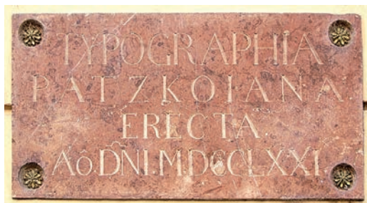
1. kép. A Patzkó nyomda emléktáblája Pozsonyban, Ventur utca 5. sz.

Ennek az emléktáblának (1–2. kép), amely Pozsony sétálóutcájának egyik házán található, érdekessége, hogy nem a későbbi utókor, esetleg a műemlék-vevédelemmel foglalkozó hatóság állította, hanem maga a Patzkó nyomda alapítója, tulajdonosa.