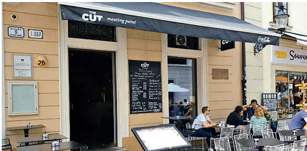
2. kép. Az emléktábla az 5. számú ház homlokzatán, jobb oldalt

Nyomdája kezdetben az akkori Kiskáptalan utca 37. sz. (a mai Prepostská 10. sz.) alatt dolgozott, és az emléktábla eredeti helye is itt volt. A vörös márvány táblán arany betűkkel olvasható a Typographia Patzkoiana erecta A[nn]o DNI .