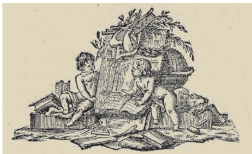
5. kép. „Hafe” szignójú könyvdísz a Patzkó-nyomdából: a szignó a jobb oldali puttó lába előtt látható

Egyedülálló a hazai nyomdák közül az a hét változatban ismert nyomdászjelvénye, amellyel kiadványait díszítette és egyedivé tette (7. kép). A nyomtatott könyv formátumától függően alkalmazta egyiket vagy másikat, de van köztük olyan is, amelyet könyve belsejében, mintegy fejlécként alkalmazott. Hétféle jelvénye közül hatnál közös az általában írásszalagon olvasható latin jelmondat Spes confisa Deo nunquam confusa recedit . Jelentése Az Istenben bízó re-