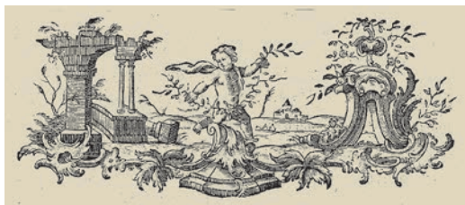
6. kép. Jellegzetes rokokó könyvdísz a Patzkó nyomdából

Egyedülálló a hazai nyomdák közül az a hét változatban ismert nyomdászjelvénye, amellyel kiadványait díszítette és egyedivé tette (7. kép). A nyomtatott könyv formátumától függően alkalmazta egyiket vagy másikat, de van köztük olyan is, amelyet könyve belsejében, mintegy fejlécként alkalmazott. Hétféle jelvénye közül hatnál közös az általában írásszalagon olvasható latin jelmondat Spes confisa Deo nunquam confusa recedit . Jelentése Az Istenben bízó re-