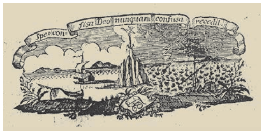
7. kép. A Patzkó nyomda egyik jelvénye 16

ménység soha meg nem csalatkozhat. Némelyik kisebb alakú jelvényén csak a mottó első szavai találhatók Spes confisa Deo (Az Istenben bízó reménység). A jelvényekben a szikla, vitorlás hajó, a háborgó és nyugodt tenger motívuma mindig előfordul, ugyanúgy, mint a kép alján a nyomdász kagylóba foglalt monogramja, az F.A.P. betűk. A hetedik jelvényről, a naptárain használt