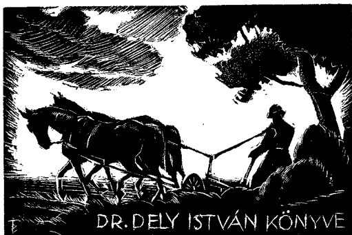
4. ábra. Bánszki Tamás fametszete, 67 × 108 mm

1960-as években. Ezek alkalmával számos grafikát ajándékozott a múzeumnak. 1964-től tagja lett a Képzőművészeti Alapnak.