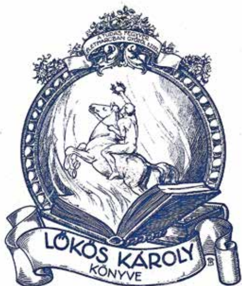
7. ábra. Bánszki Tamás grafikája, 100 × 83 mm

Lőkös Károly könyvjegyén a tudás hatalma fogalmazódik meg: nyitott könyv szerepel lovasal, „A tudás fegyver, életharcban győzöl ezzel” felirattal. (7. ábra)