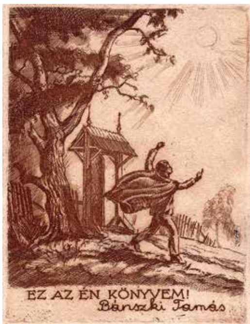
8. ábra. Bánszki Tamás rézkarca, 118 × 90 mm

„A végtelenül szerényen és magányosan élt idős művészt mindenki tisztelte, szerette. Tamás bácsi úgy szórta szét közöttünk finom lírájú akvarelljeit, mint egy leveleit hullató öreg fa, mely épp oly észrevétlen távozik a természetből, mint ahogyan ő elment most a mi körünkől” – e szavakkal búcsúzott tőle Szelesi Zoltán 1971-ben. Munkásságából halála után több helyütt is emlékkiállítás rendeztek, például Földséakon (2008), Makón (1995, 2014), Debrecenben (2014), Szegeden (2015). A sokoldalú művészre a hazai ex libris életben való részvétele okán is van miért emlékeznünk.