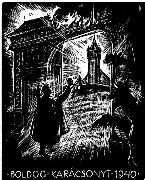
2. ábra. Bánszki Tamás fametszete, 100 × 80 mm

Kanszky Márton ajánlásával jelent meg, és a művész hat metszetét ( Földeáki Madonna, Madonna, Angyali üdvözlés, Szent György, Immaculata, Golgota ) tartalmazza, melyek témái a megtestesülés és a megváltás: „A fa és a vas, a kéz és a lélek konzonanciája okozza azt, hogy Bánszki Tamás spirituális tartalma e képeiről, önkénytelenül is a maga teljes egészében kiárad, mert belőlük, a lélek szól a lélekhez!” (Kanszky). (1–2. ábra)