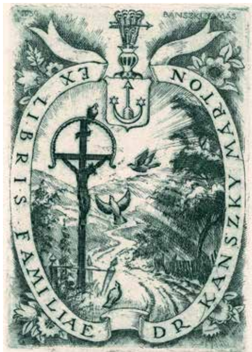
6. ábra. Bánszki Tamás rézkarca, 110 × 75 mm