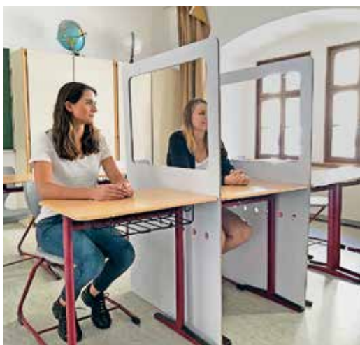
Az EcoSafeBoard „Education Edition”

Németországban a Schuhmacher Pack Solutions GmbH különböző változatokat kínál az EcoSafeBoard hullámkarton válaszfalból, amely két ember közé helyezhető olyan irodákban, ügyfélszolgálatokon, ahol nem képesek a minimális távolságot tartani. Az EcoSafeBoard „Education Edition”