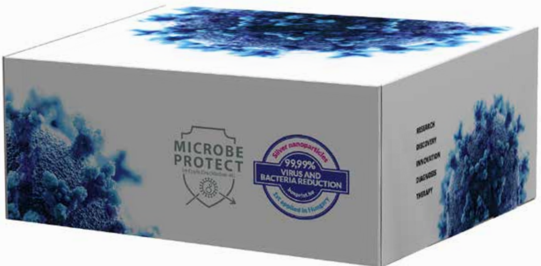
Koronavírus teszter doboz

A koronavírus elleni küzdelemben a Box Print nem csupán a speciális, mikrobiális védelmet adó lakkal vesz részt, hanem specializálódott a védőmaszkok nagyüzemi dobozcsomagolásának,